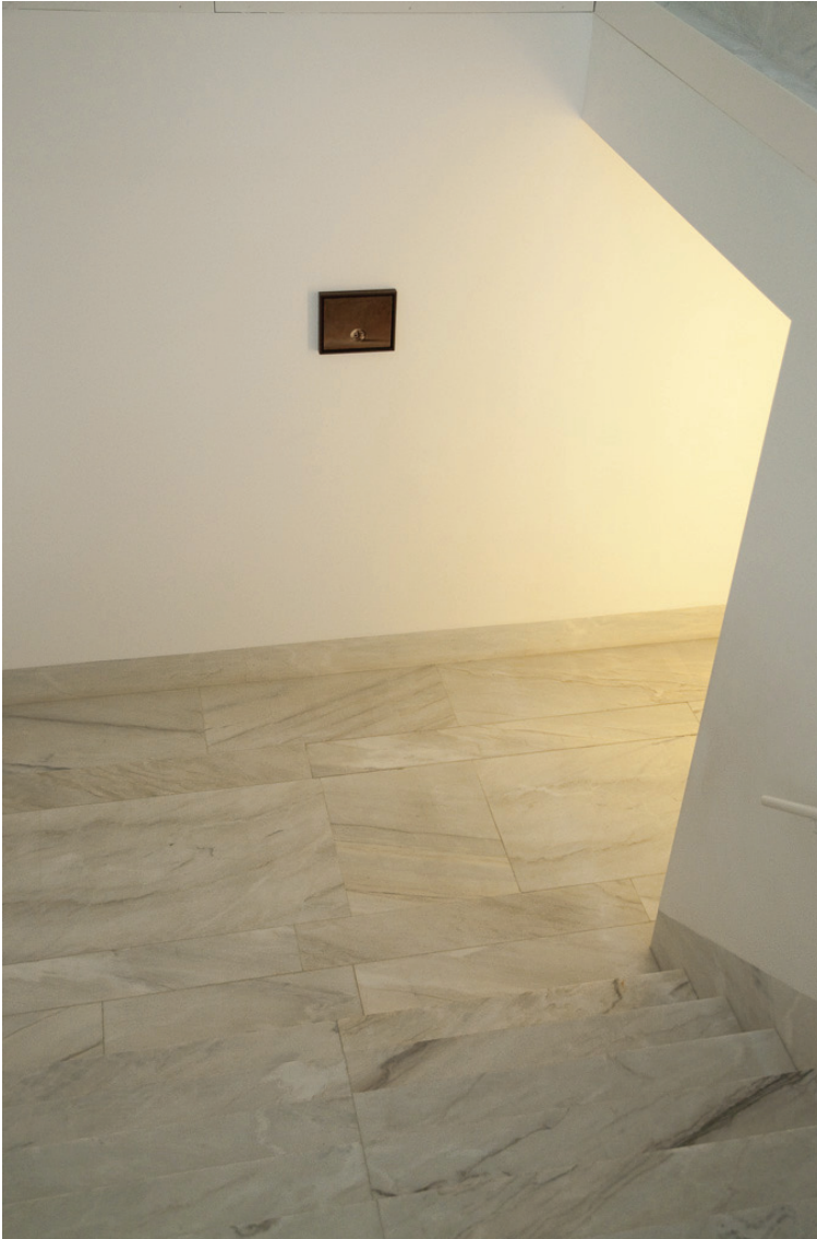
Miguel Branco (1963) Sem Título (série Caveiras ), 1993 Óleo sobre madeira 19 x 24 cm N.º Inventário 360830