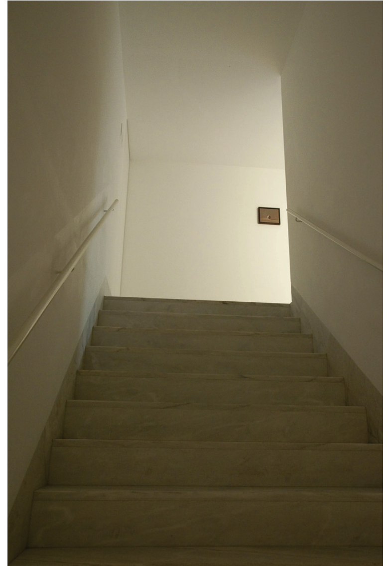
Miguel Branco (1963) Sem Título (série Caveiras ), 1993 Óleo sobre madeira 19 x 24 cm N.º Inventário 360829 Cortesia do artista