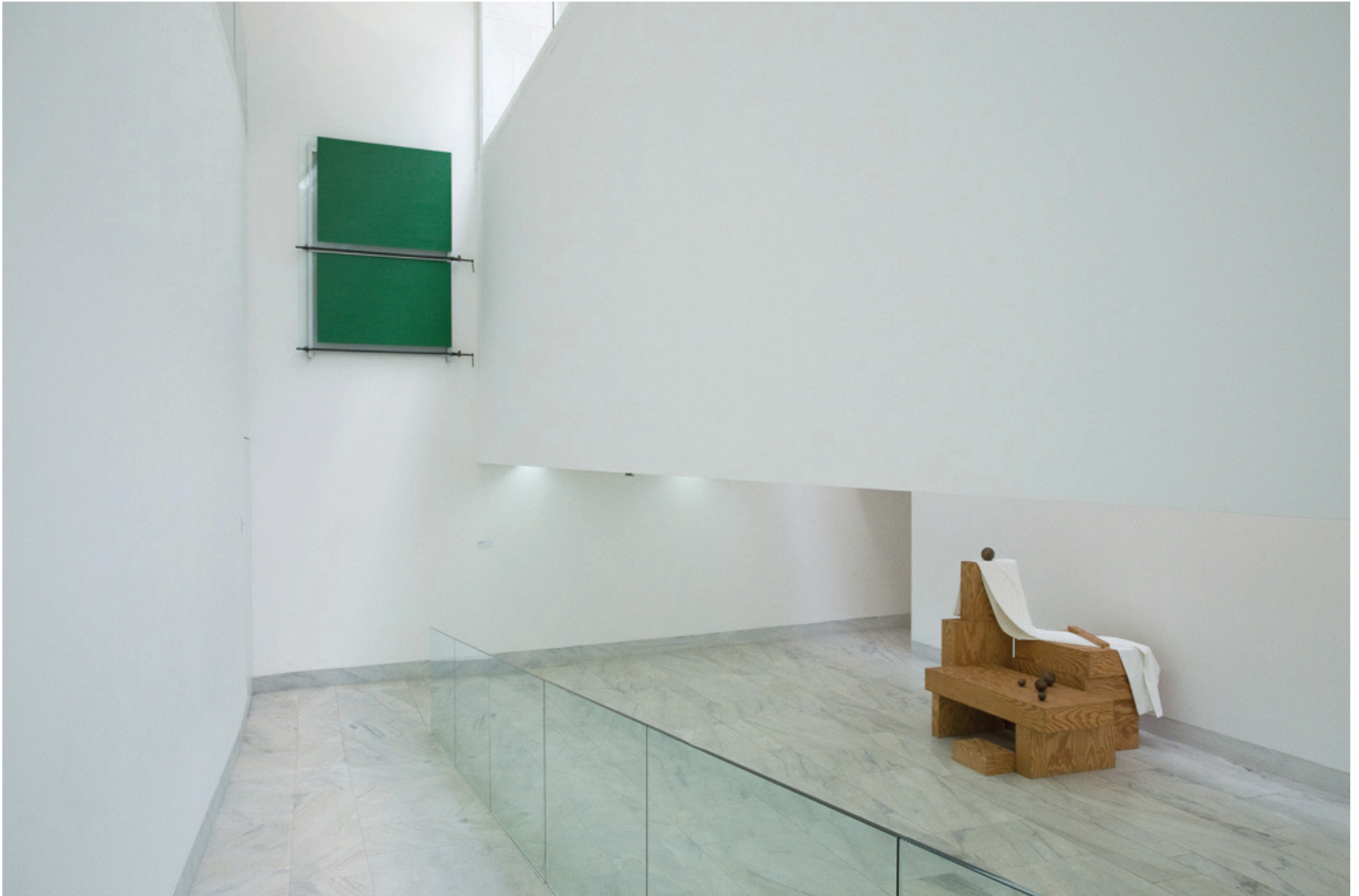
Pedro Cabrita Reis (1959) Double Monochrome Green (PW6) , 2000 Alumínio e acrílico sobre vidro 220 x 182 x 13 cm N.º Inventário 528651