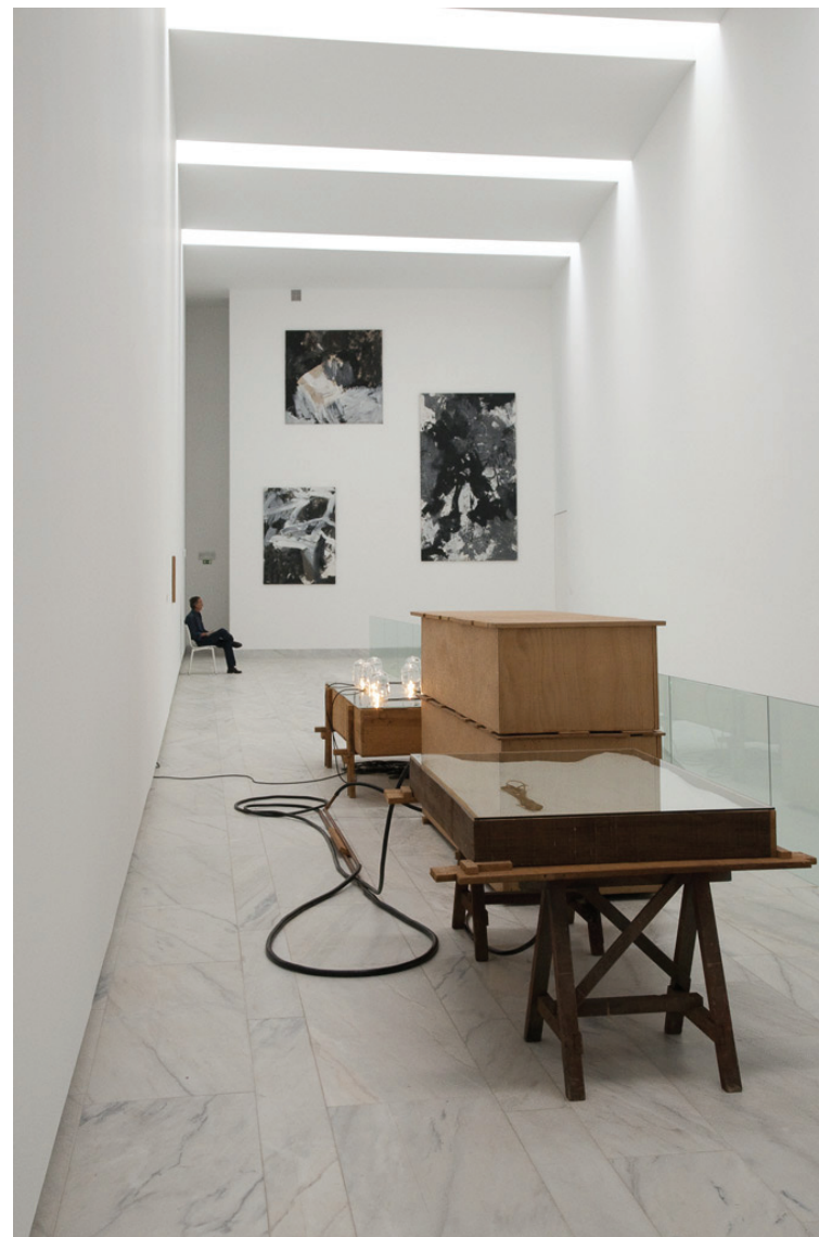
Vista da exposição