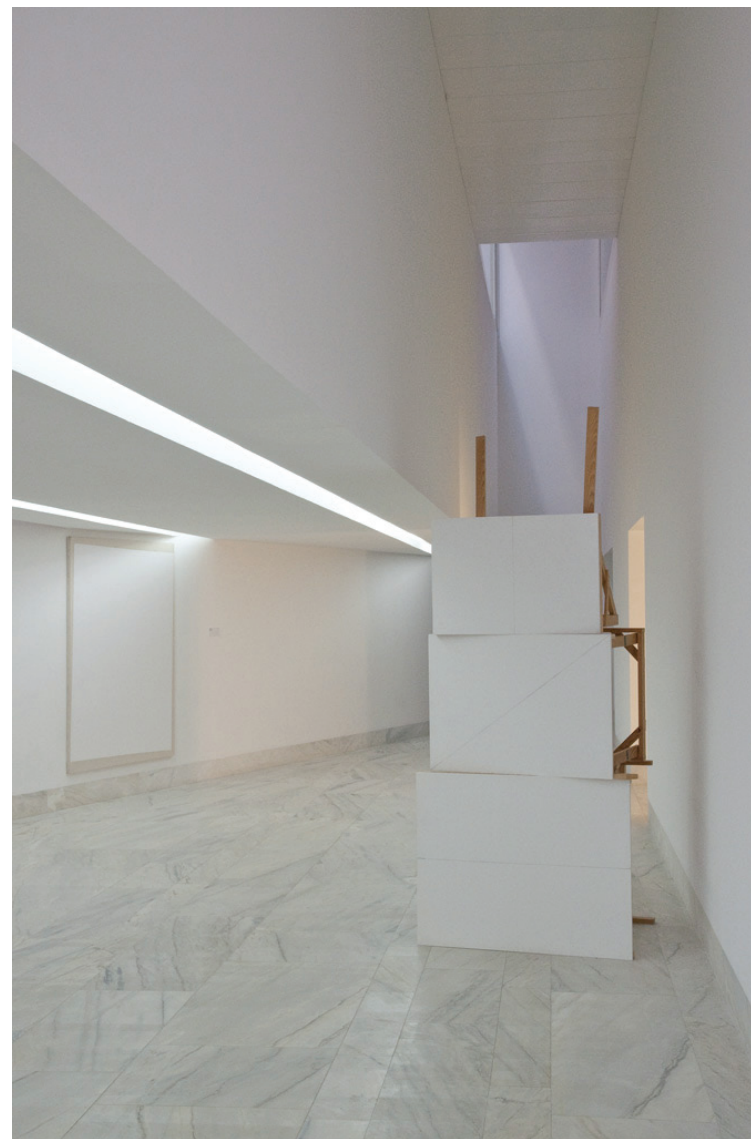
Hugo Canoilas (1977) Uma Ideia Clara , 2002 Acrílico sobre tela 190 x 144 cm N.º Inventário 573504