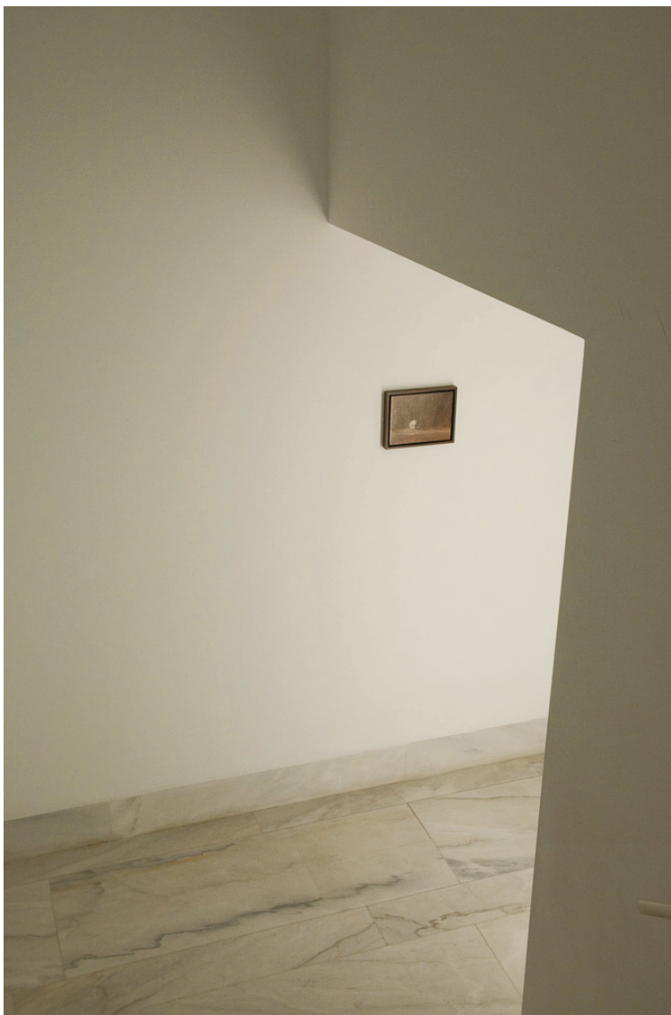
Miguel Branco (1963) Sem Título (série Caveiras ), 1990 Óleo sobre madeira 18 x 23,5 cm N.º Inventário 360828