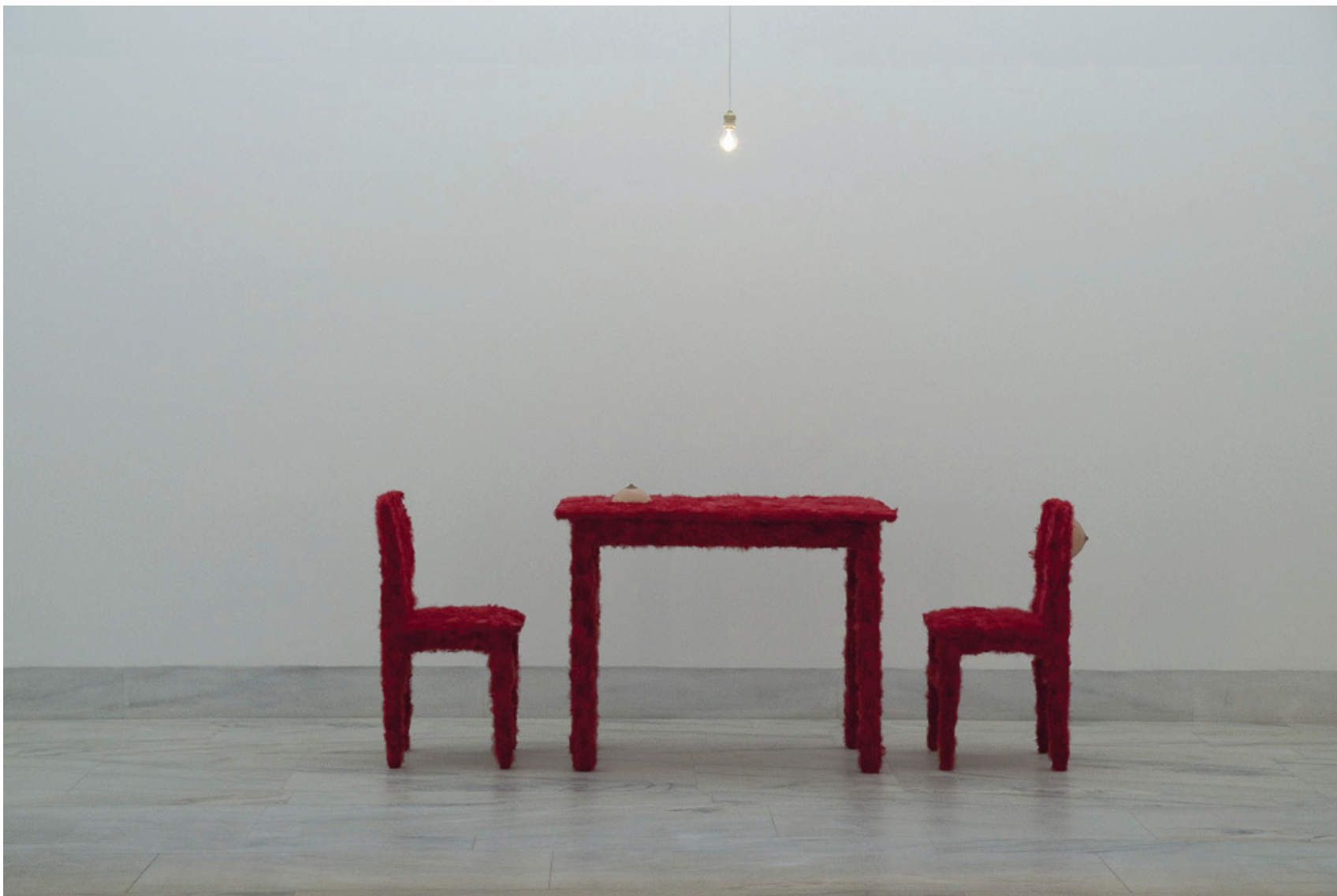
Lygia Pape (1929-2004) Banquete Tupinambá , 2000 Mesa e duas cadeiras cobertas de penas vermelhas 77 x 140 x 92 cm N.º Inventário 533756 Cortesia do artista