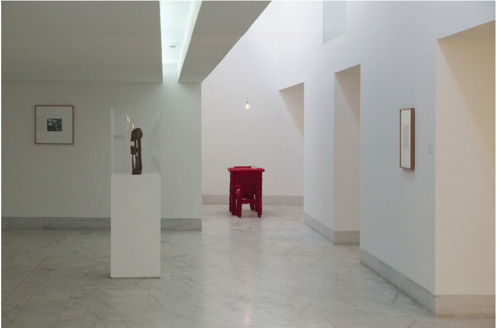
Vista da exposição