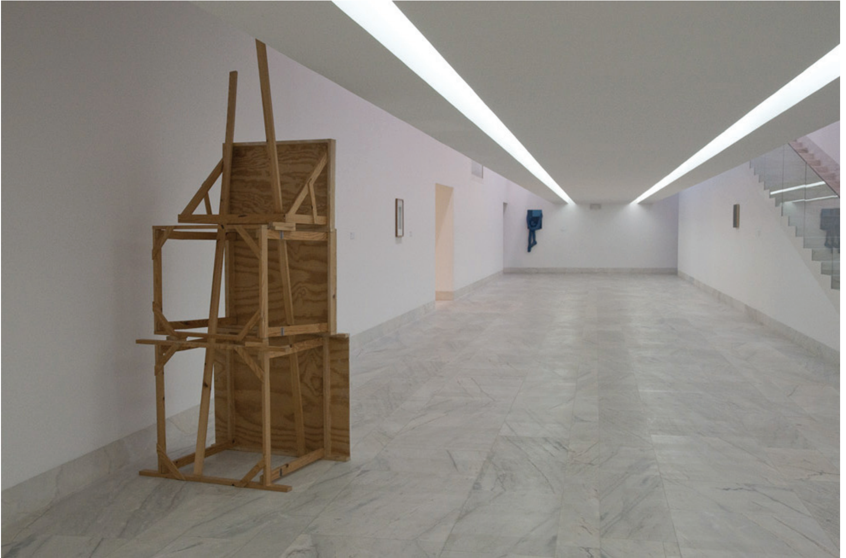
Vista da exposição