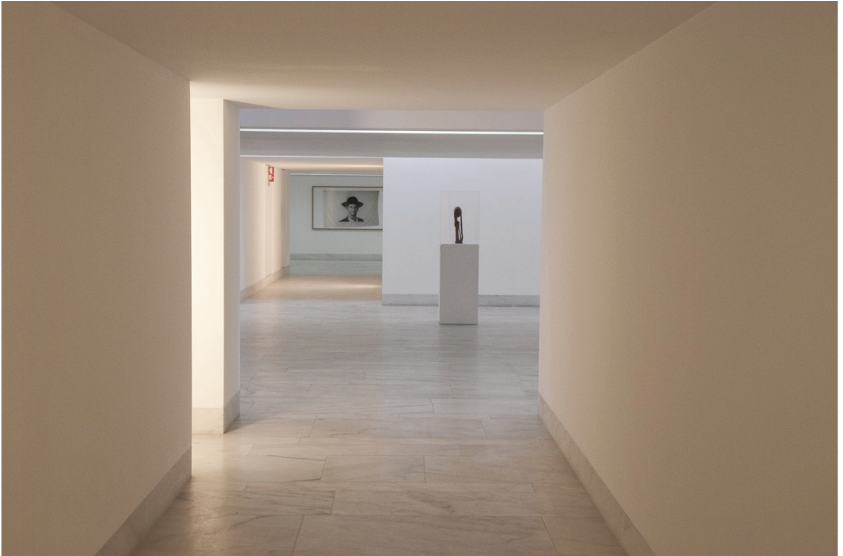
Jimmie Durham (1959) Sem Título, 1997 Serigrafia sobre tecido 95 x 150 cm N.º Inventário 563811