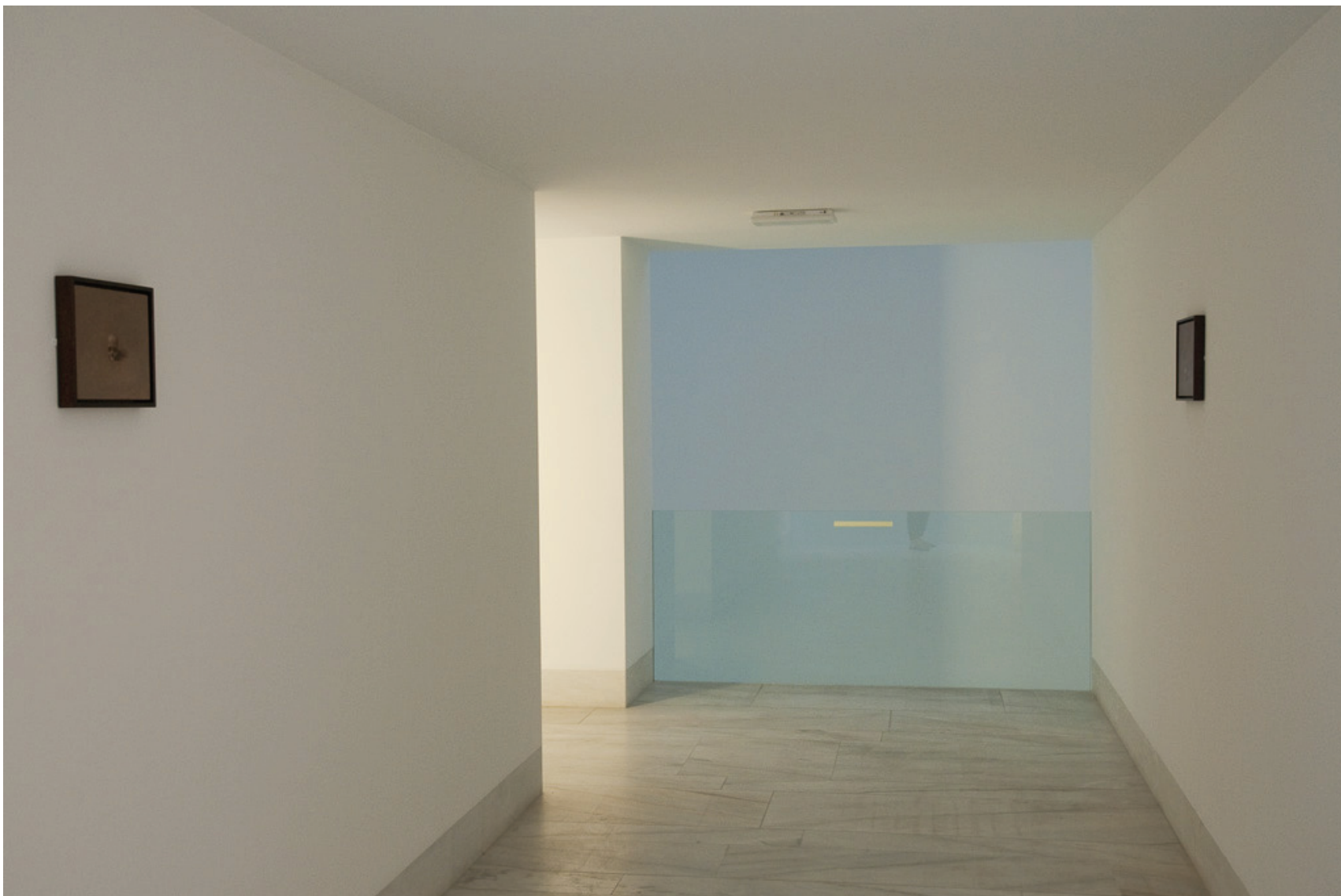
Miguel Branco (1963) Sem Título (série Caveiras ), 1992 Óleo sobre madeira 19 x 24 cm N.º Inventário 422025