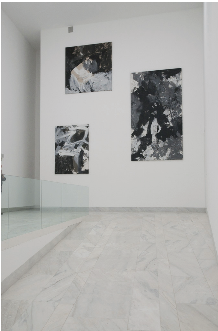
Vítor Pomar (1949) Sem Título, 1983 Acrílico sobre tela 193,5 x 143 cm N.º Inventário 336293