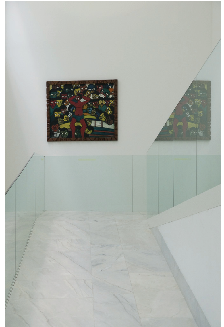
Malangatana (1936) Cela 4 - Expectativa, 1967 Óleo sobre platex Moldura de Langa, 1972 96 x 121 cm N.º Inventário 567551 Cortesia do artista