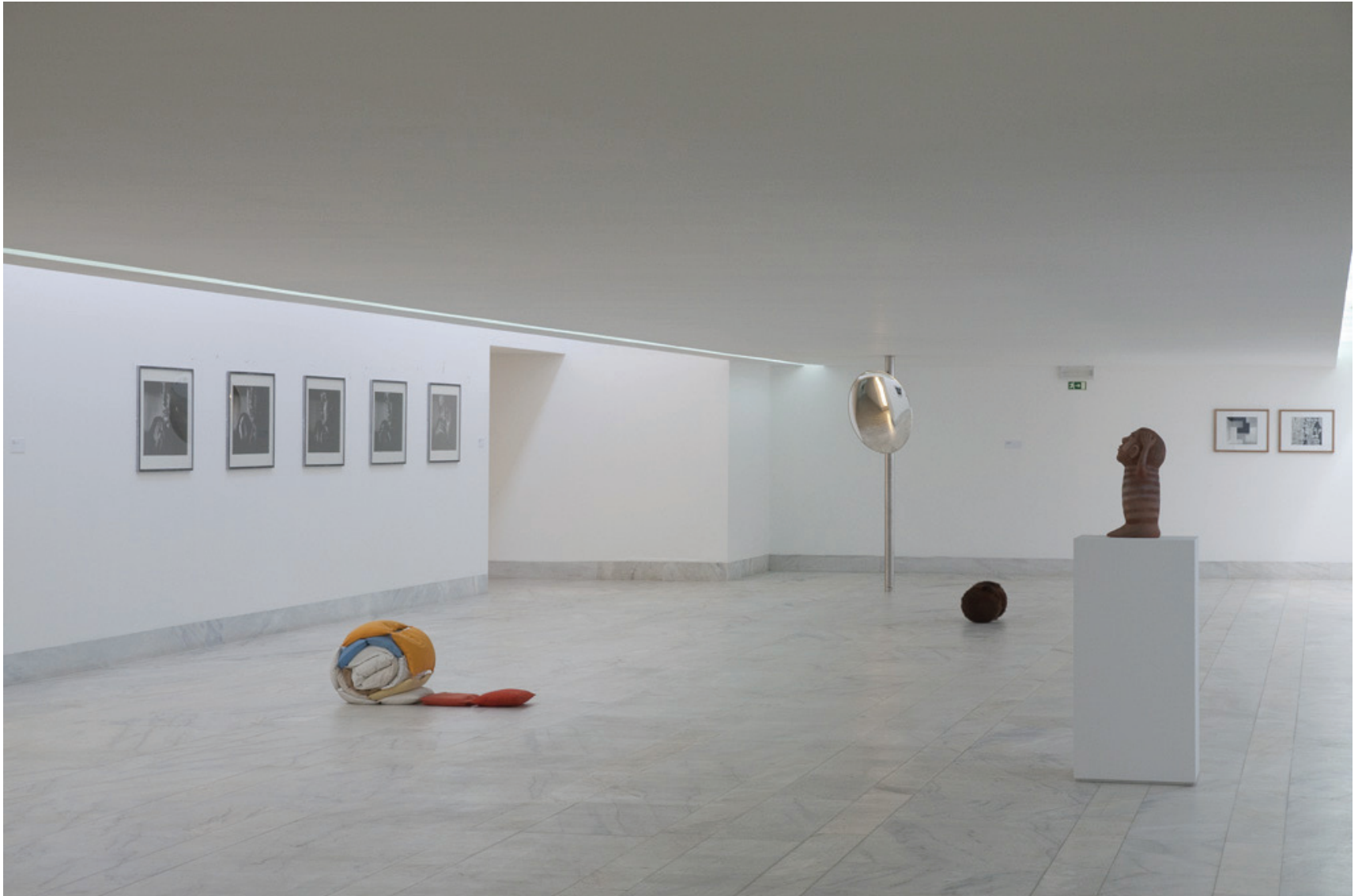
Vista da exposição