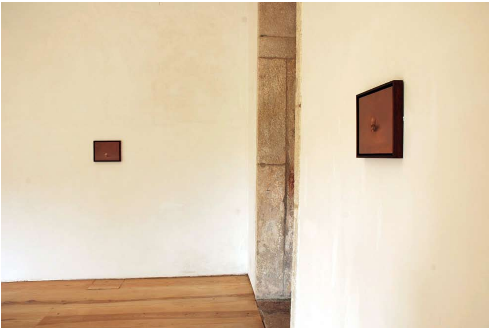
14. Miguel Branco (1963) Sem Título (Série Caveiras), 1990-93 Óleo sobre madeira · 22,5 x 30 cm; 19 x 24 cm · Cortesia do artista Vista da instalação na Sala do Taco