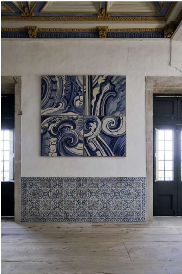
3. Adriana Varejão (1964) Azulejões (com volutas) - políptico , 2000 Massa de cola e gesso, pintado a óleo sobre tela · 4 x (100 x 100 cm) · Cortesia da artista Fotografia: Arne Kaiser · Vista da instalação na Ouvidoria