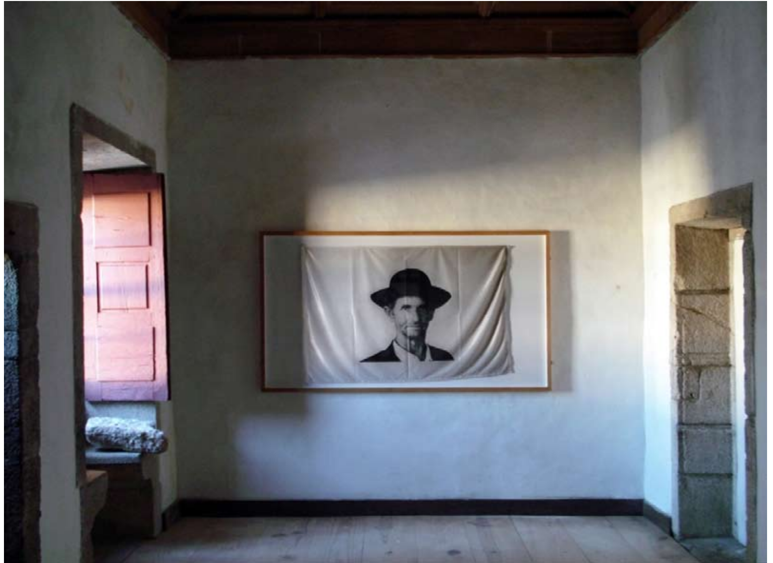
13. Jimmie Durham · Sem Título, 1997 Serigrafia sobre tecido · 95 x 150 cm Vista da instalação na Barbearia/Botica