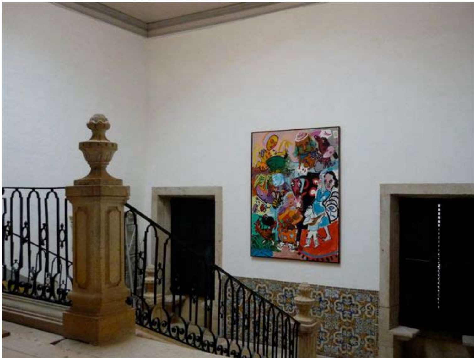
2. Paula Rego (1935) The Mosquito's House , 1984 Acrílico sobre tela · 245 x 179 cm · Cortesia da artista Vista da instalação na Escadaria