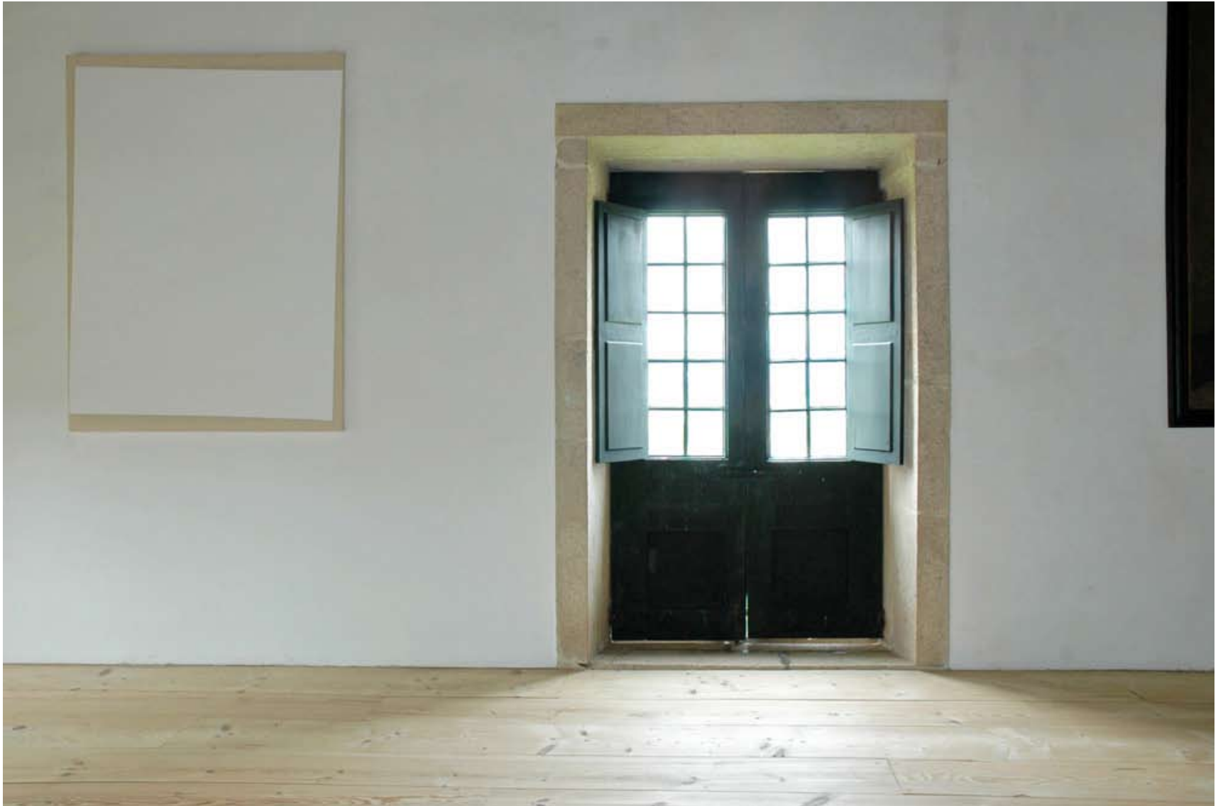
11. Hugo Canoilas (1977) Uma Ideia Clara , 2002 Acrílico sobre tela · 190 x 144 x 3 cm · Cortesia do artista Vista da instalação na Sacada da Galeria dos Gerais