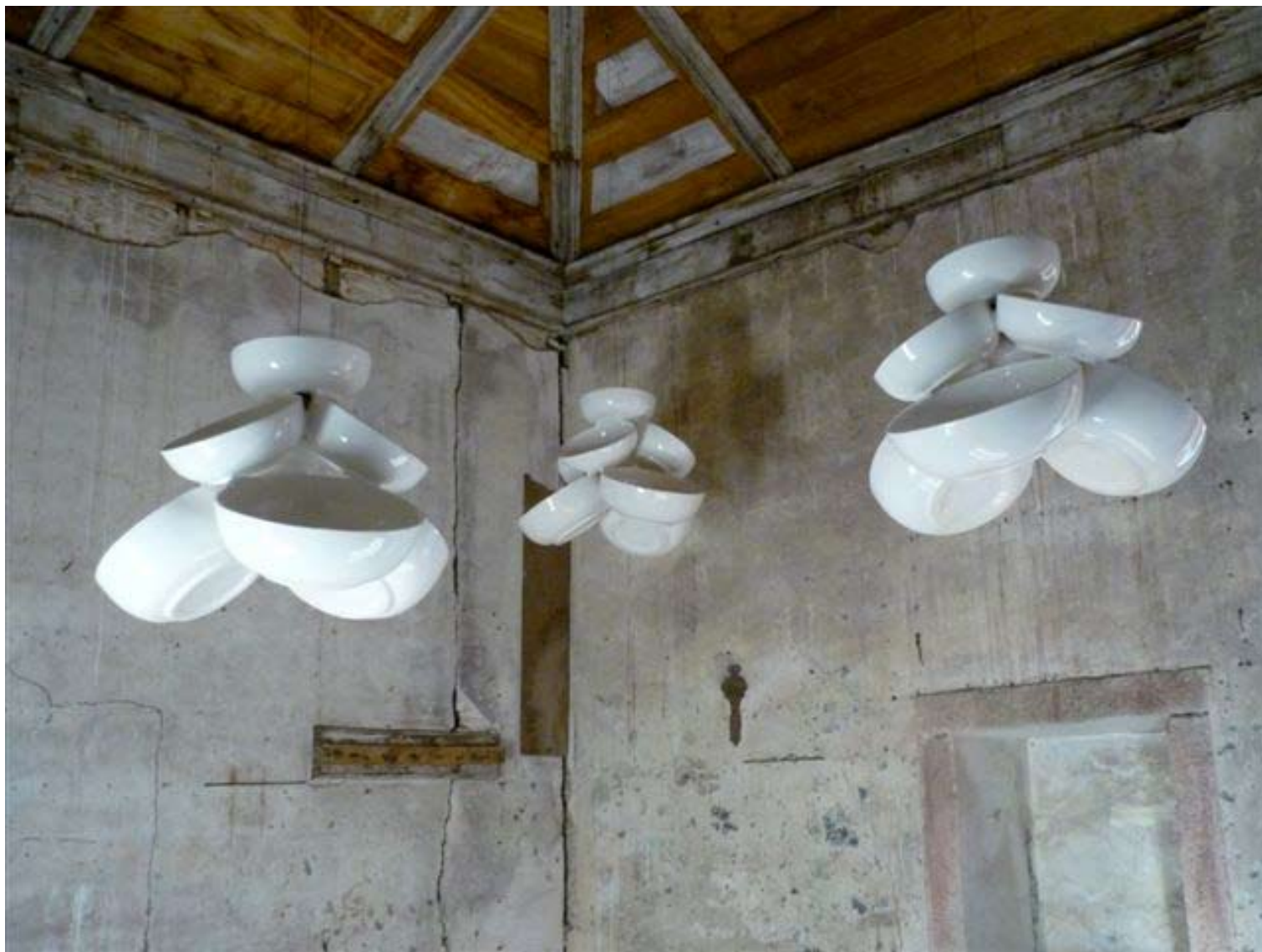
12. Valeska Soares (1957) Les Tournants , 2000 Cerâmica e cabo de aço · Dimensões variáveis · Cortesia da artista Vista da instalação nas Celas da Hospedaria