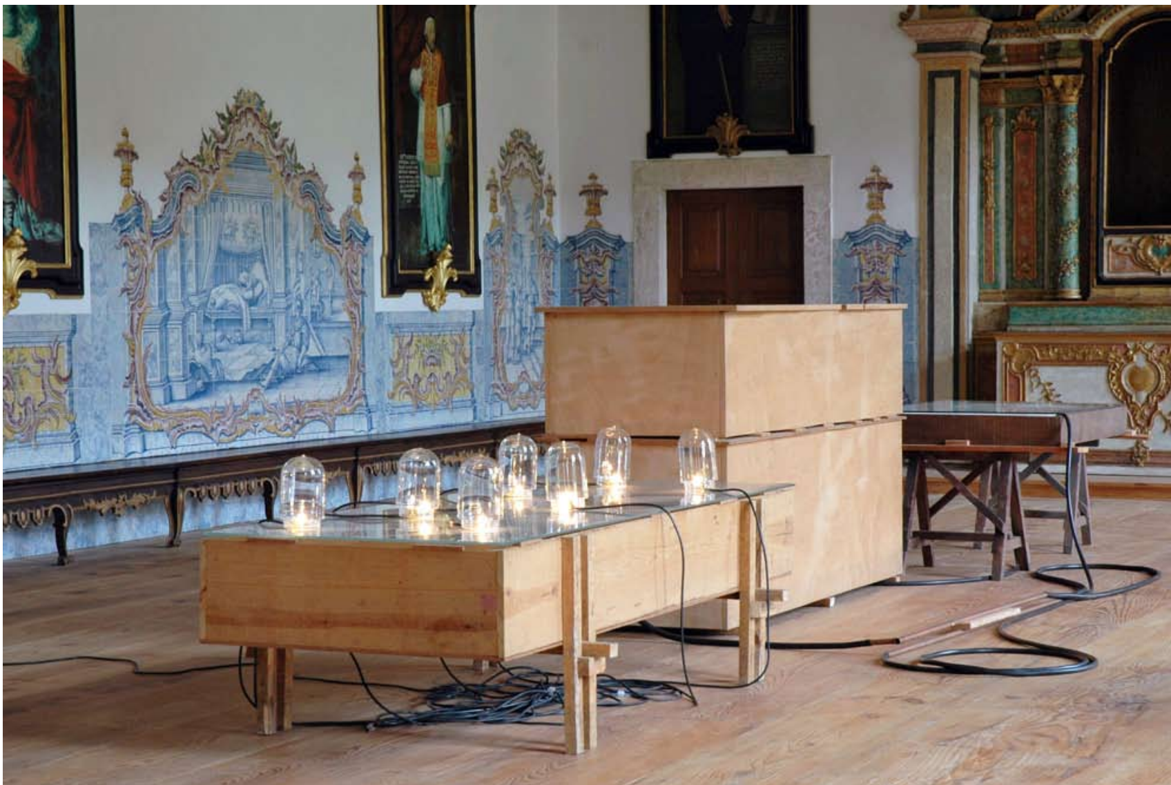
15. Pedro Cabrita Reis (1956) H Suite (XII) , 1993

Madeira, vidro, tubos em cobre, mangueira de borracha, pano-cru, campânulas de vidro, lâmpadas, cabos eléctricos e corda. · 150 x 140 x 700 cm · Cortesia do artista Vista da instalação na Sala do Capítulo