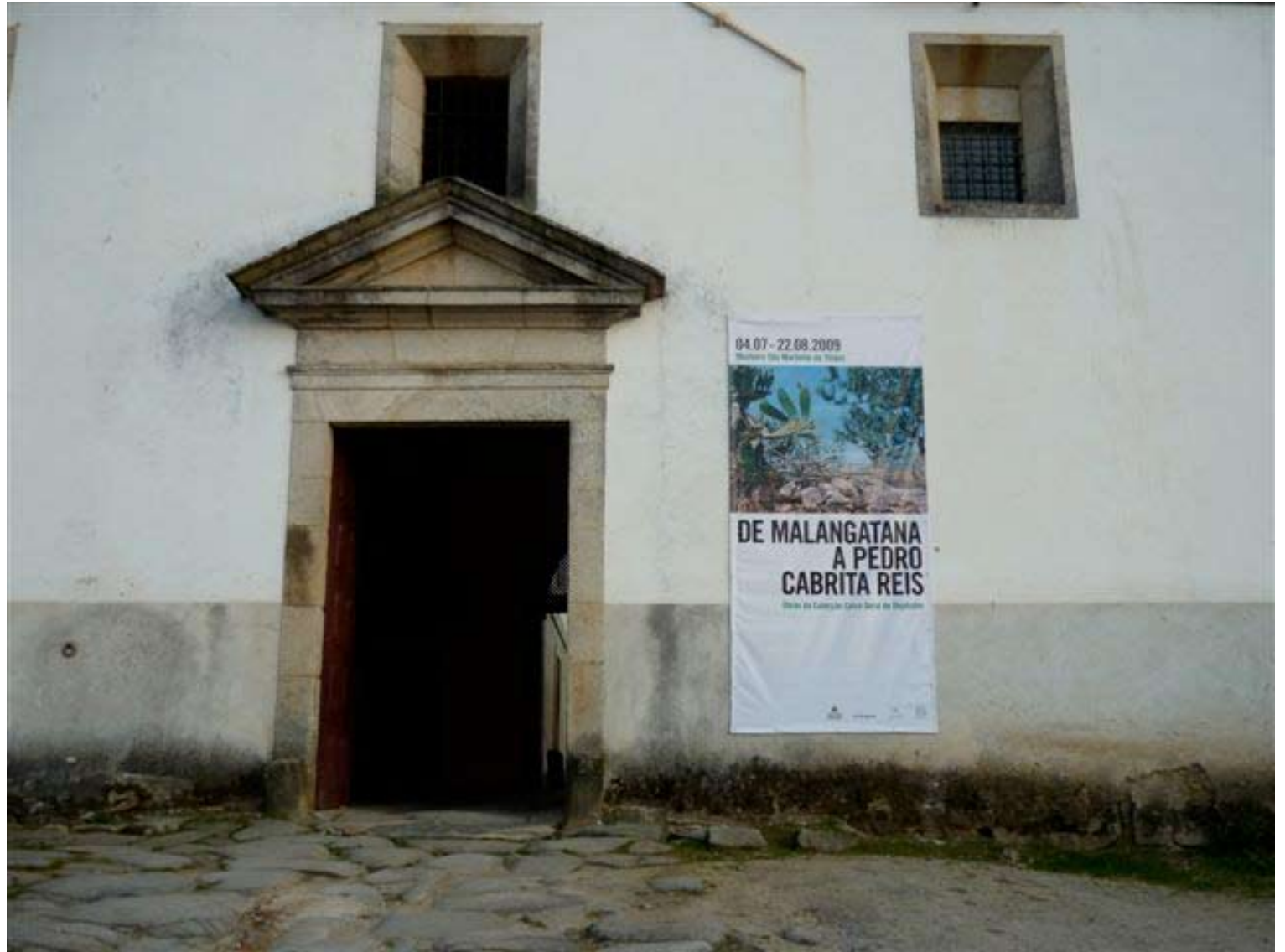
1. Entrada na exposição