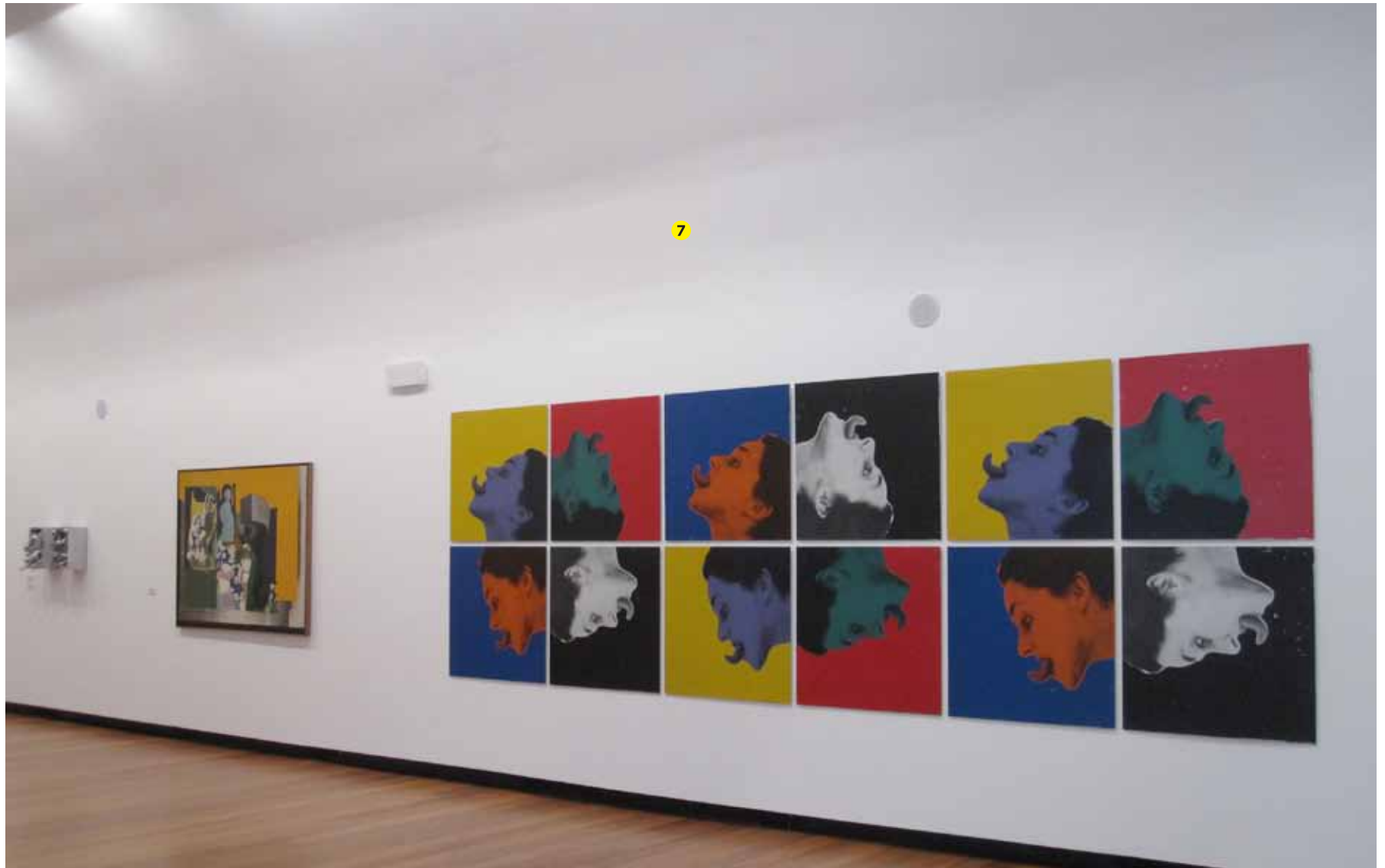
Lourdes Castro (1930) Caixa alumínio (lagostins) , Paris, 1962 Técnica mista Inventário 348001