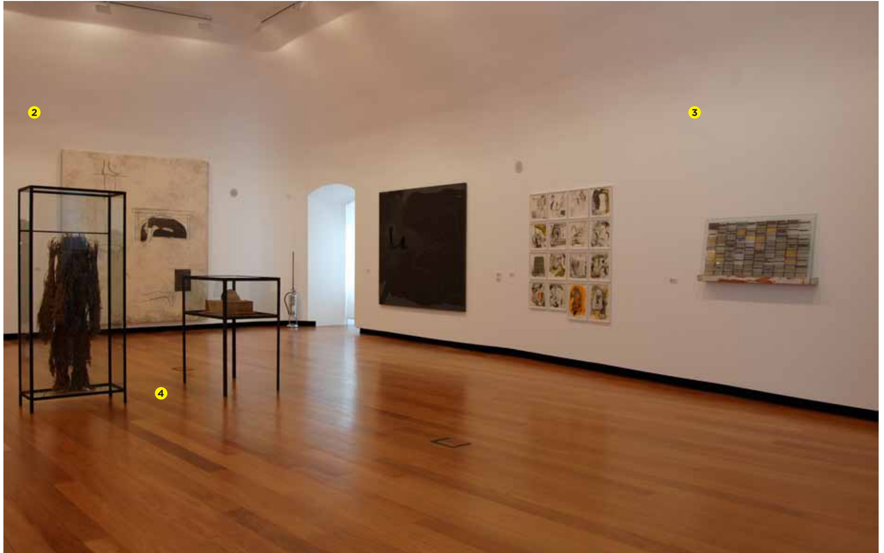
Julião Sarmiento O peso de um gesto , 1990 Acrílico sobre tela Inventário 328883