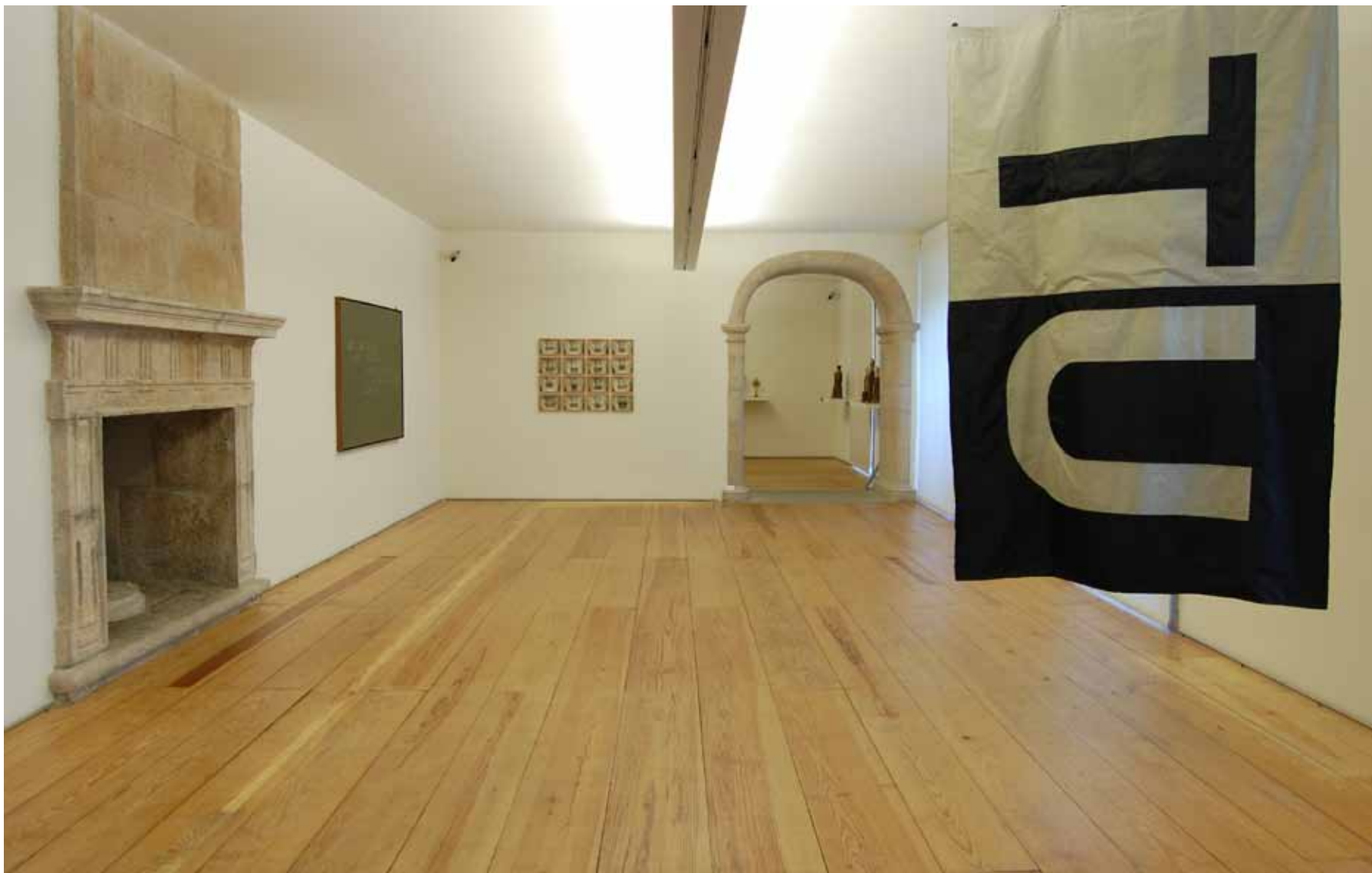
Jorge Pinheiro (1931) Mensagem inequívoca I , 1977 Acrílico sobre tela Inventário 239009