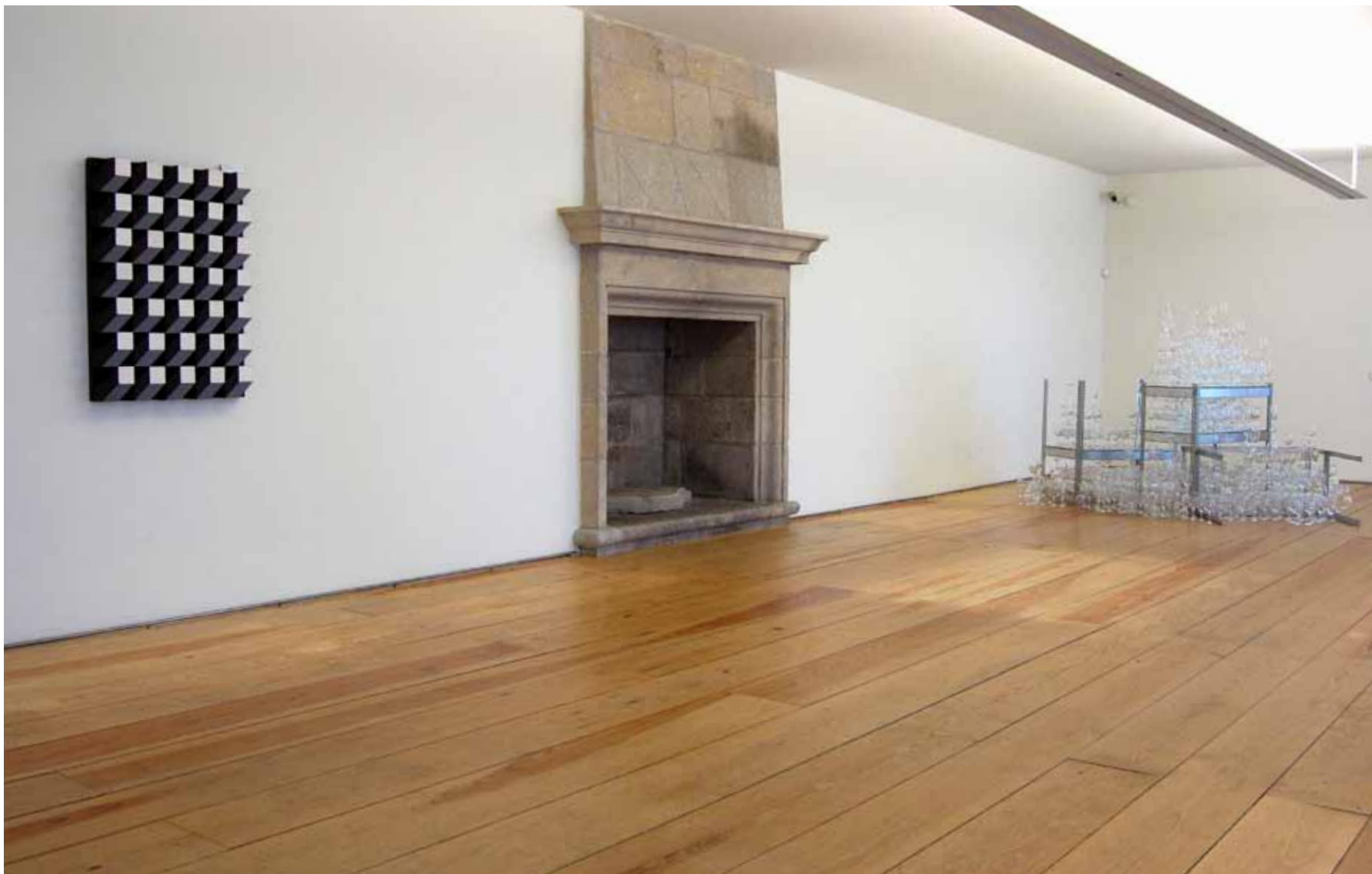
Eduardo Nery (1938) Pintura - Objecto II , 1969 Têmpera vinílica sobre madeira Inventário 584248