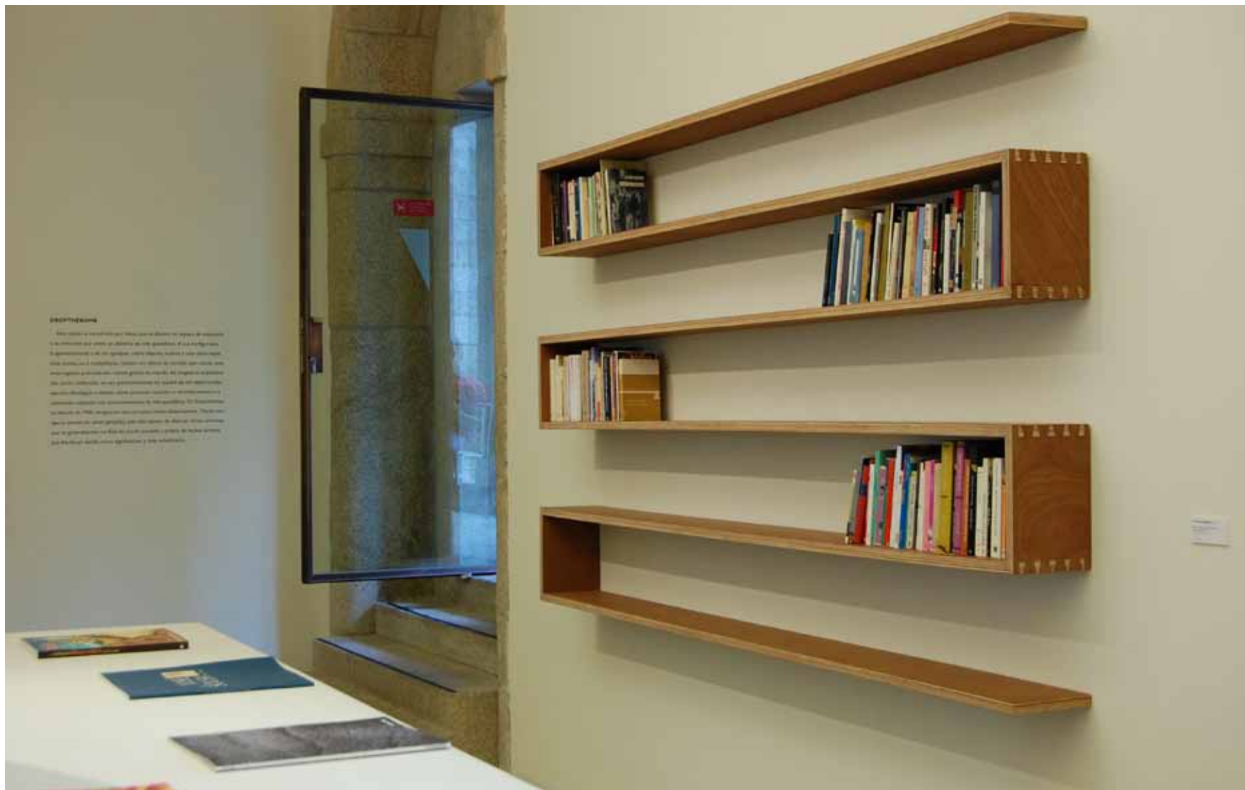
Fernanda Fragateiro Estante e colecção de livros de autores que se suicidaram, 2000 Contraplacado e livros Inventário 539307