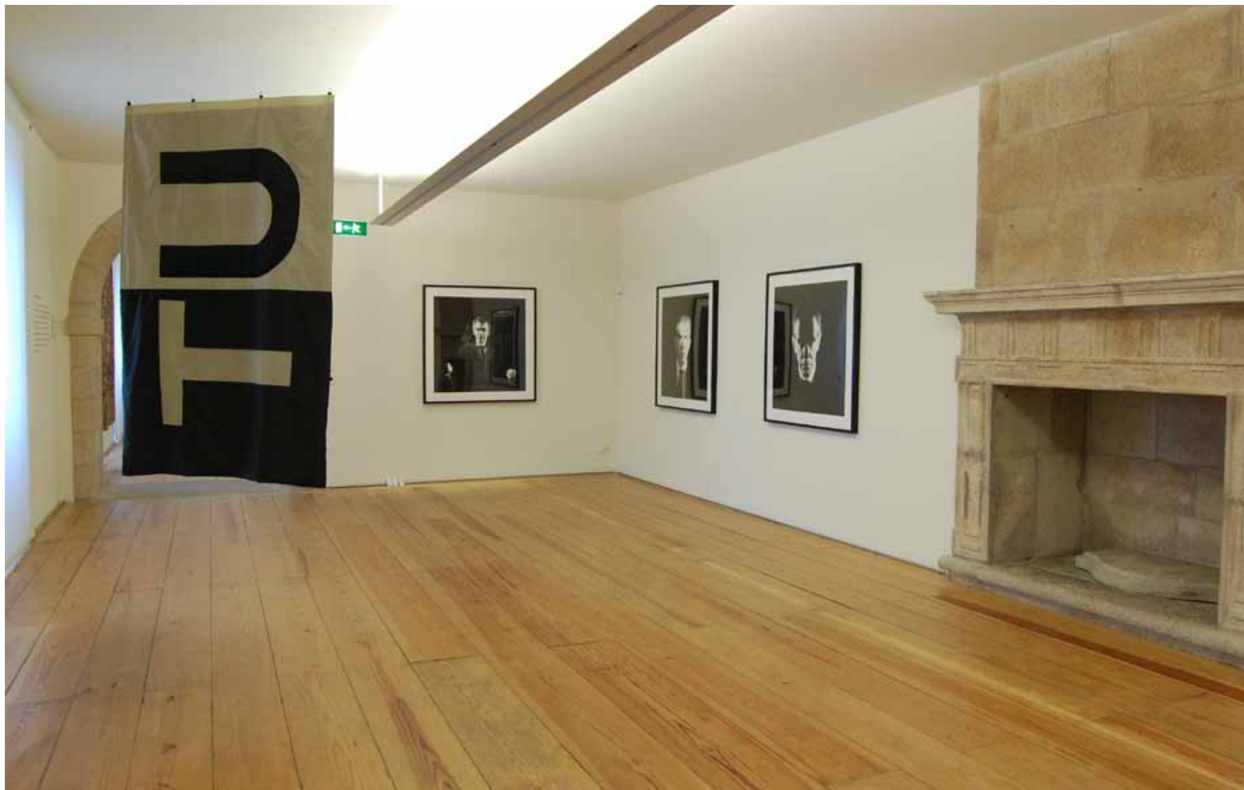
João Penalva (1949) Tu - para ser lido como eu? , 1997 Dracon Inventário 563820