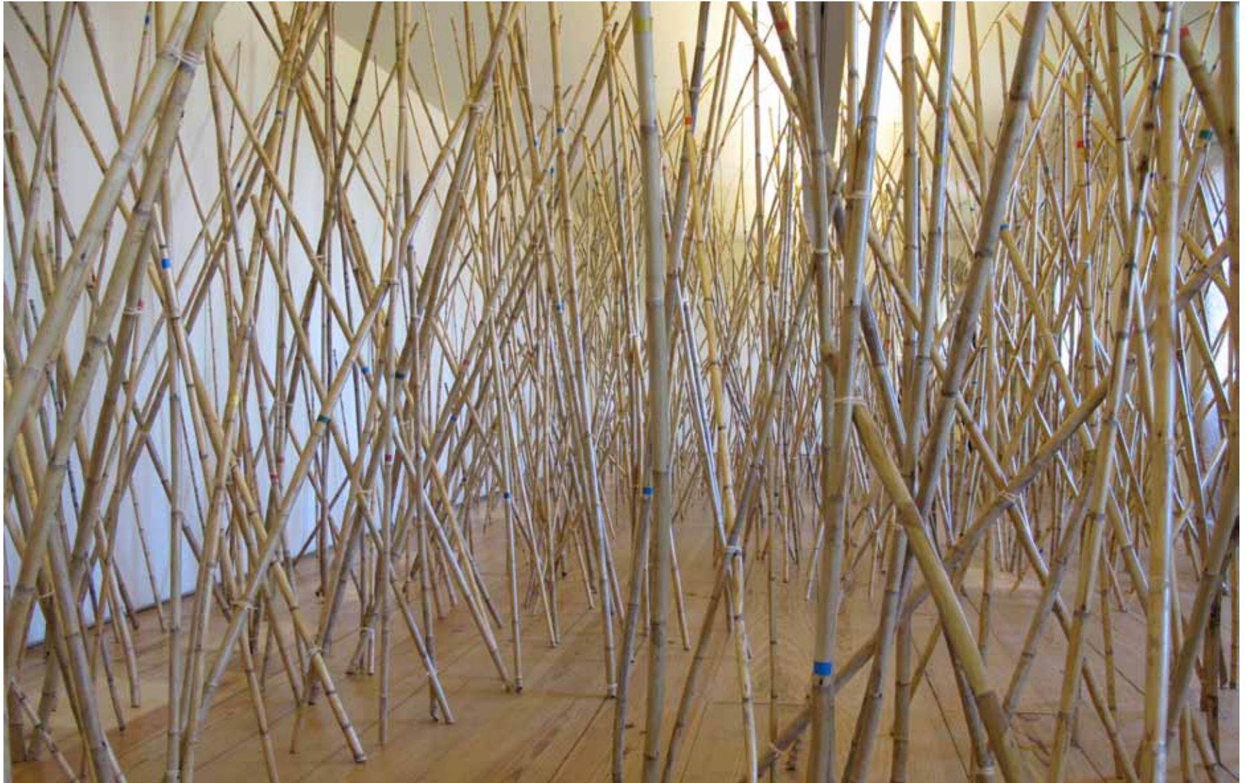
Alberto Carneiro (1937) O canavial: memória metamorfose de um corpo ausente, 1968 Canas, fitas de cor, letra de decalque e rafia Inventário 360824