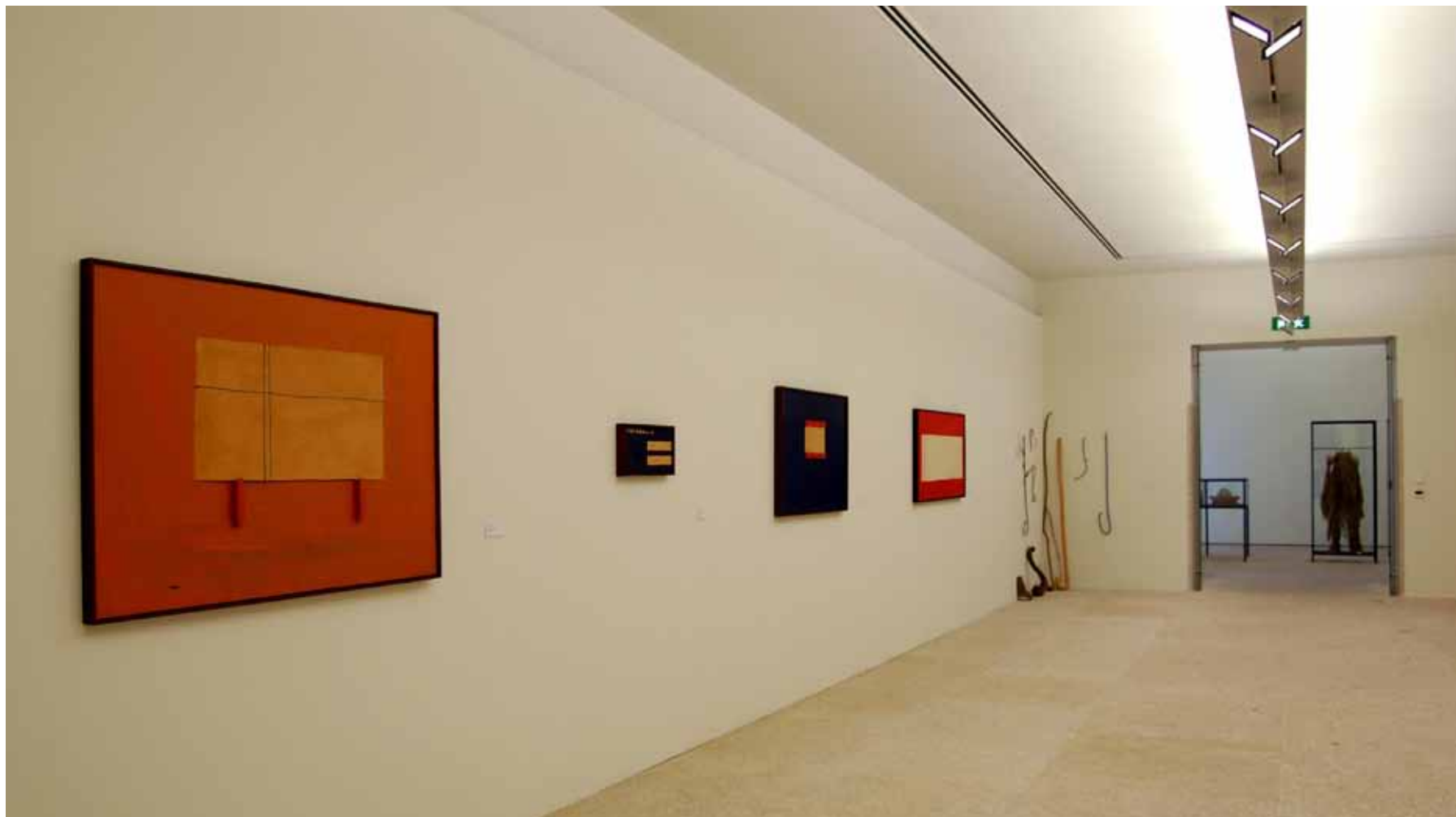
Álvaro Lapa (1939-2006) Caderno de Michaux , 1989-1990 Colagem, esmalte acrílico e marcador sobre platex Inventário 334335