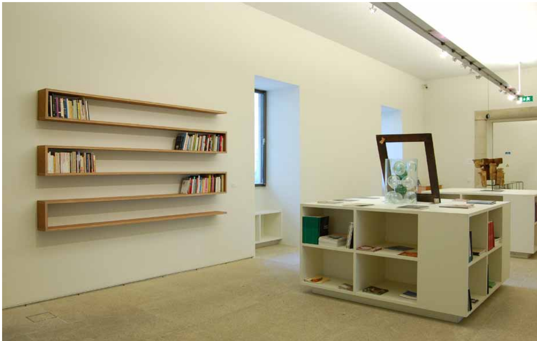
Fernanda Fragateiro (1962) Estante e colecção de livros de autores que se suicidaram , 2000 Contraplacado e livros Inventário 539307