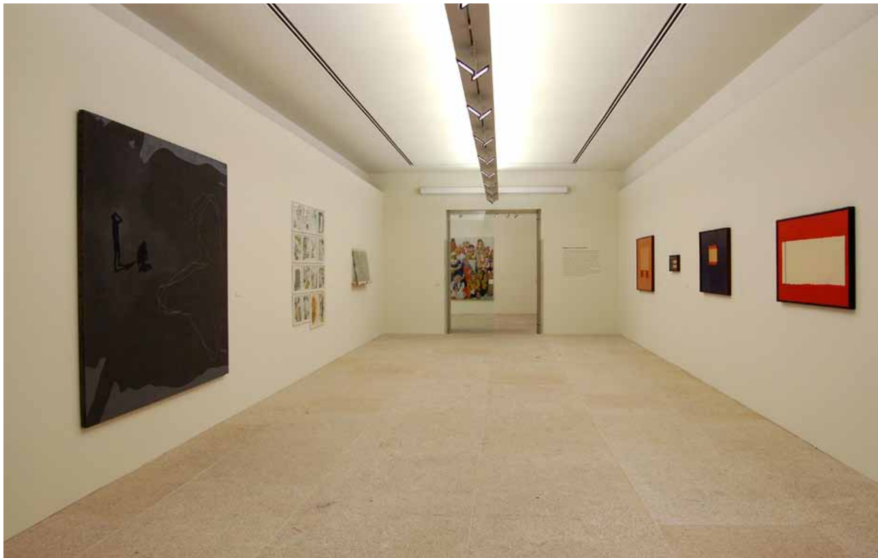
Julião Sarmento (1948) O peso de um gesto , 1990 Acrílico sobre tela Inventário 328883