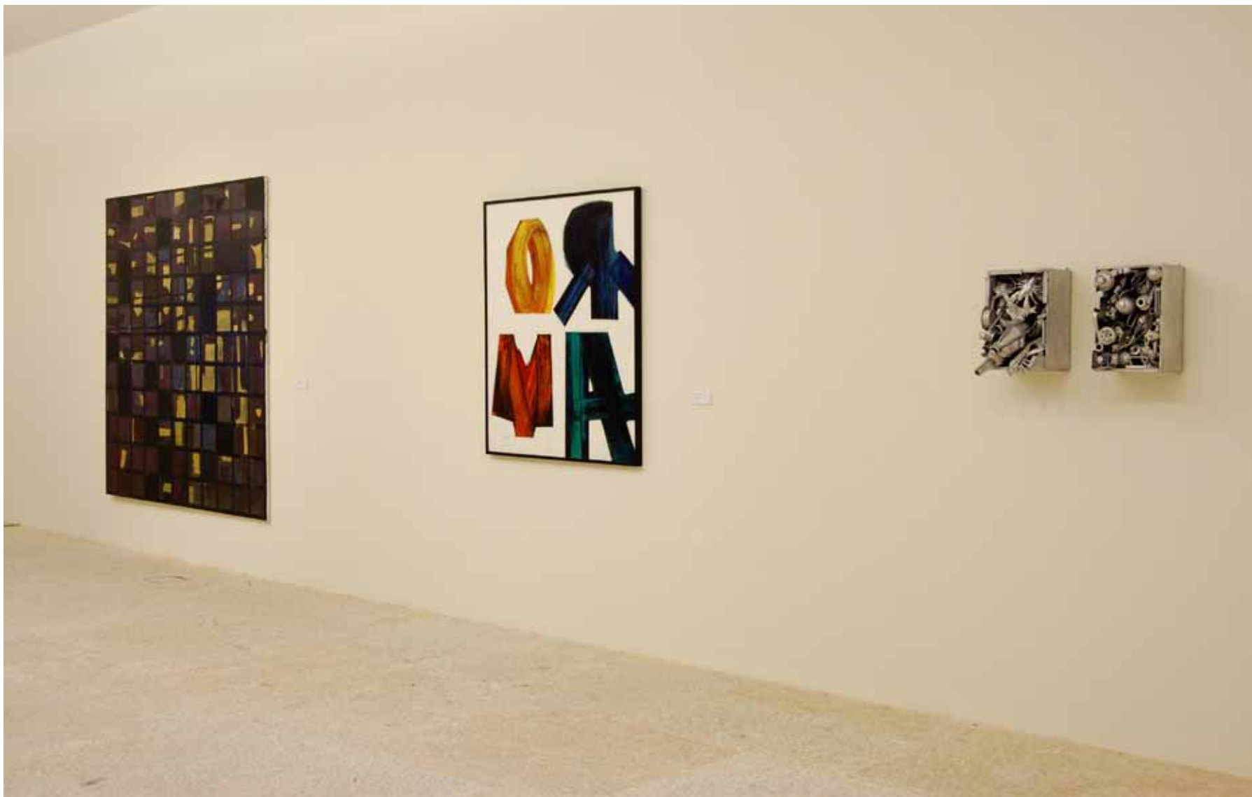
José Loureiro (1961) Palavras cruzadas IX , 1994 Óleo sobre tela Inventário 372516