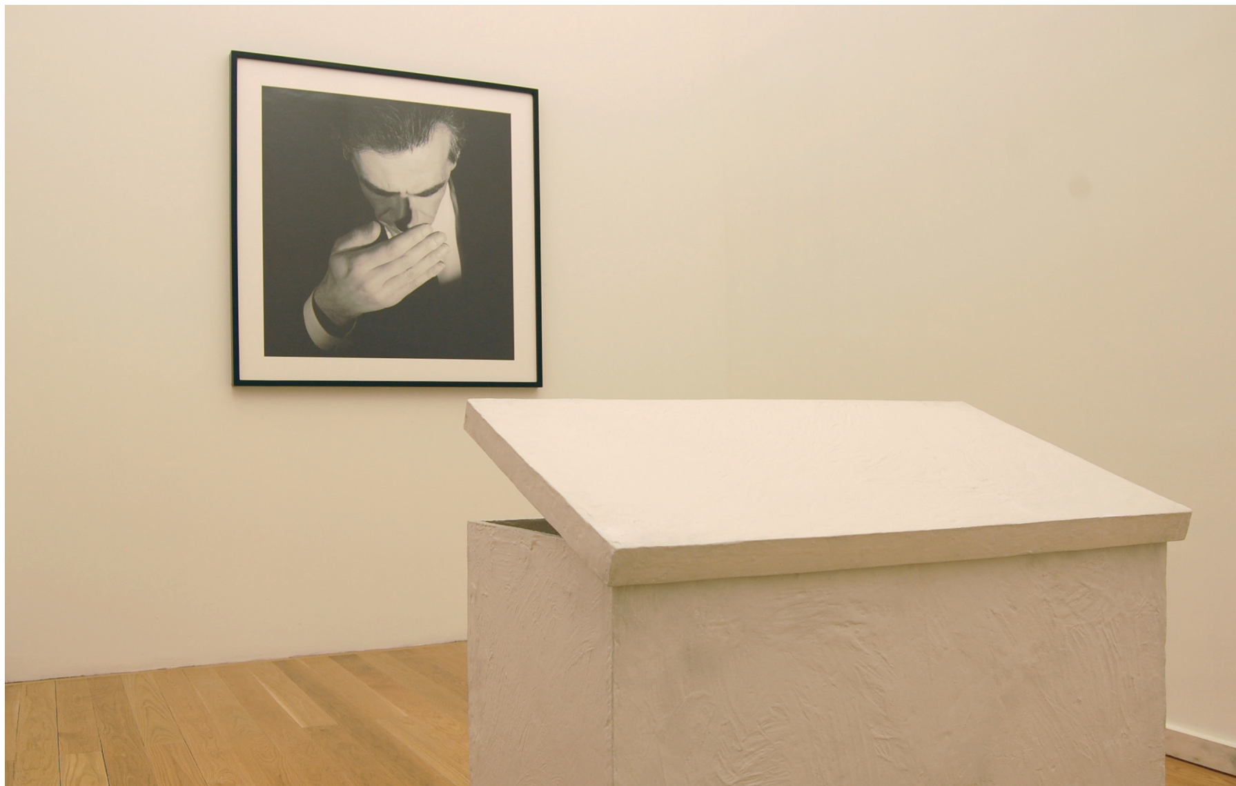
Jorge Molder Da série Inox , 1995 Prova de gelatina sal de prata, ed. 1/3 Inventário 402763