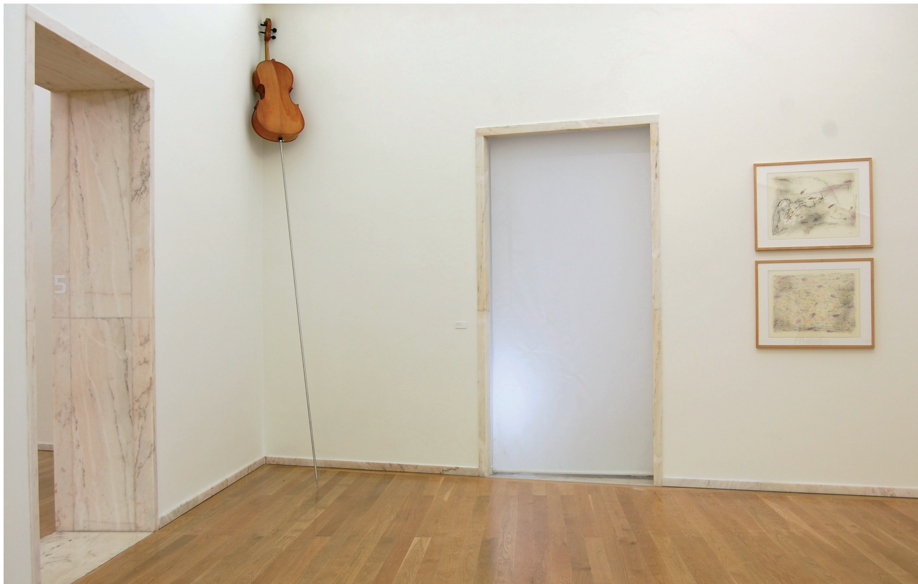
Ricardo Jacinto Violoncelo preparado , 2005 Violoncelo e varão em aço inox Inventário 602167