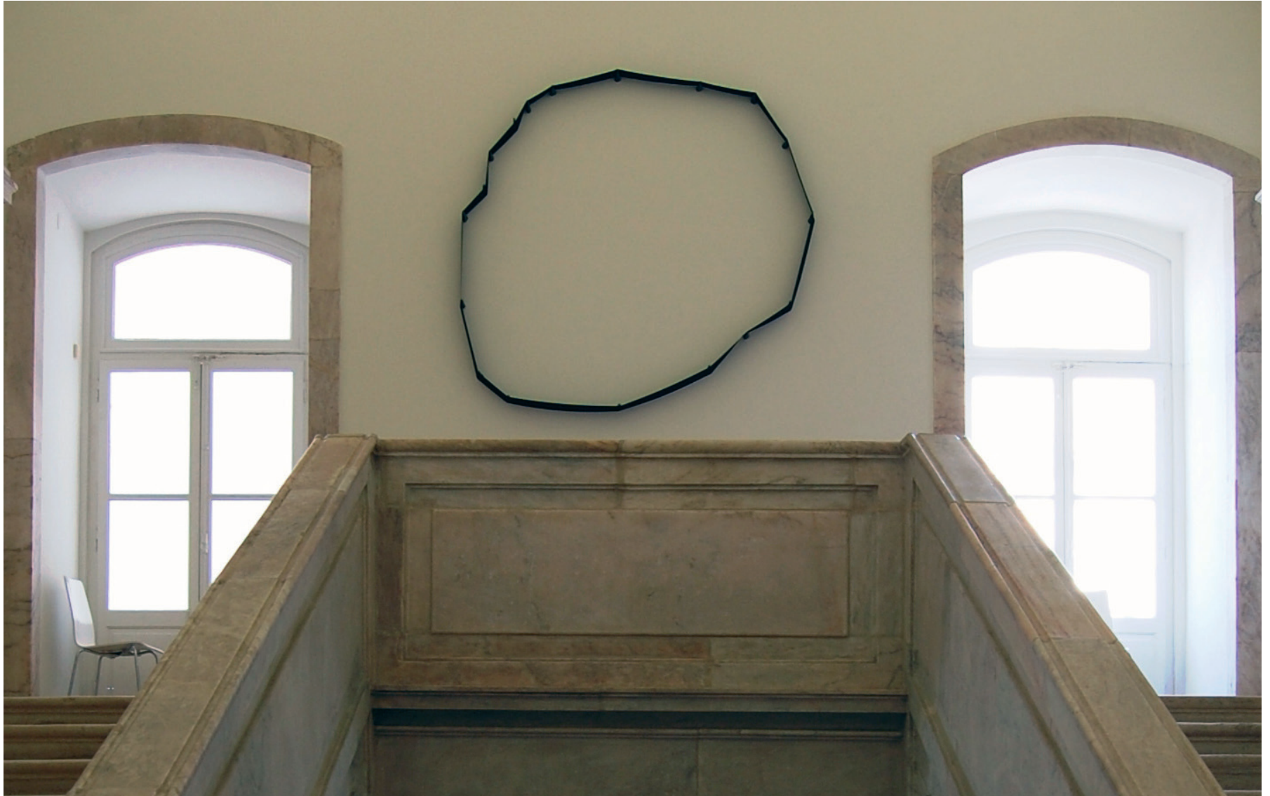
Carmela Gross Ilha I , 1995 Ferro e clástico Inventário 536932