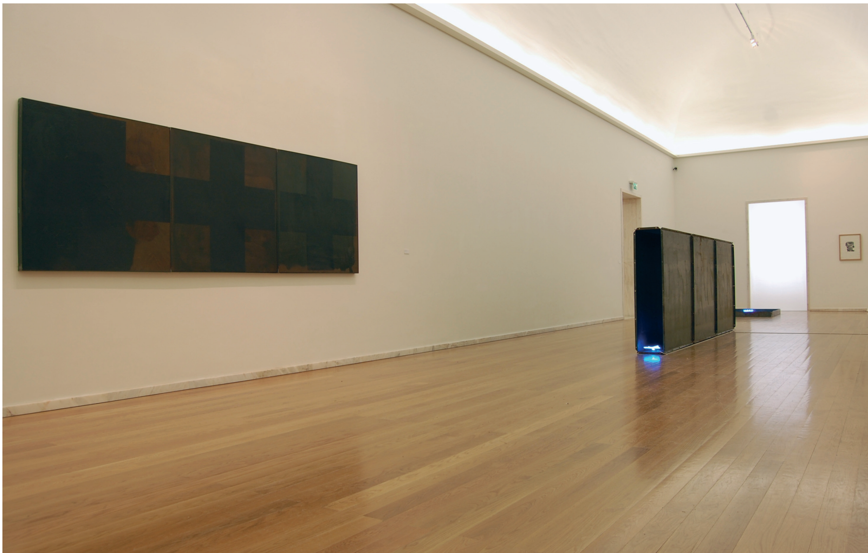
Pedro Cabrita Reis Triptico , 1986 Óleo e vernizes sobre madeira Inventário 336297