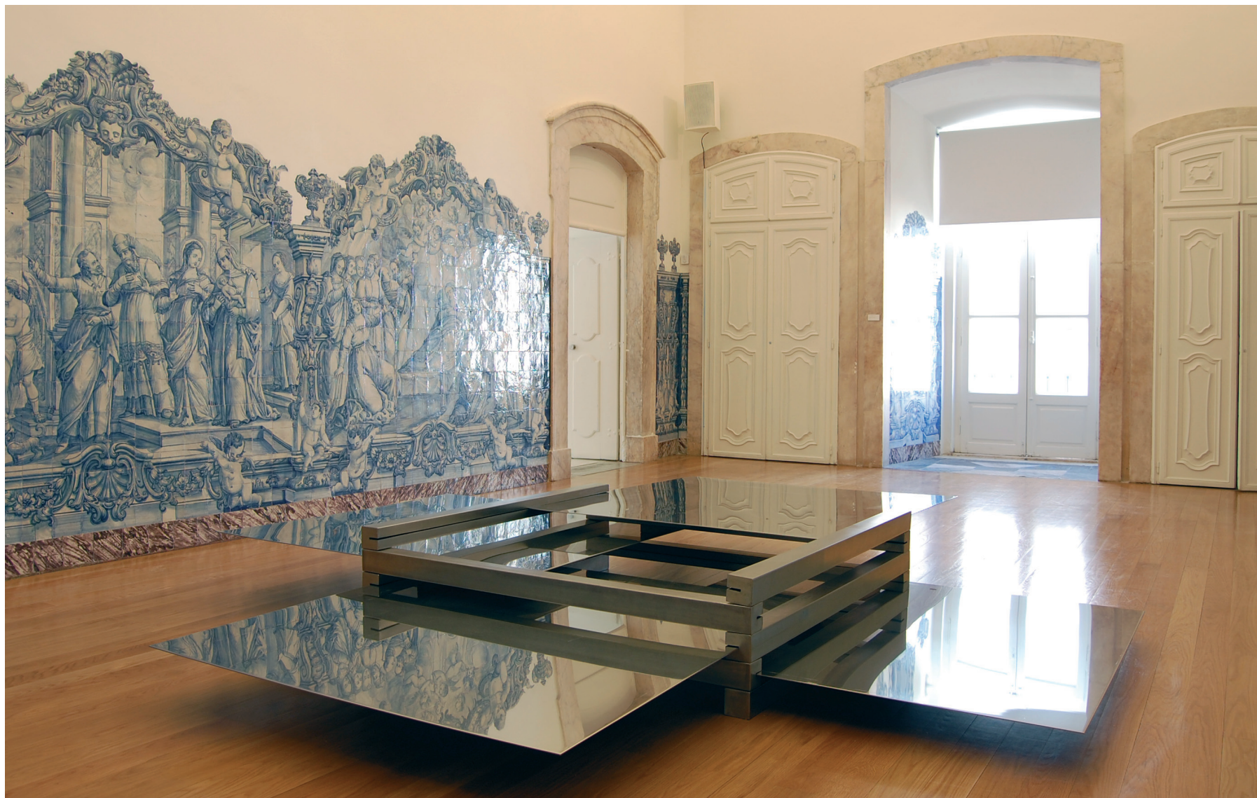
Fernanda Fragateiro But this garden, for me, looked like no other one every day I met you here, #1, 2003 Aço inox Inventário 571252