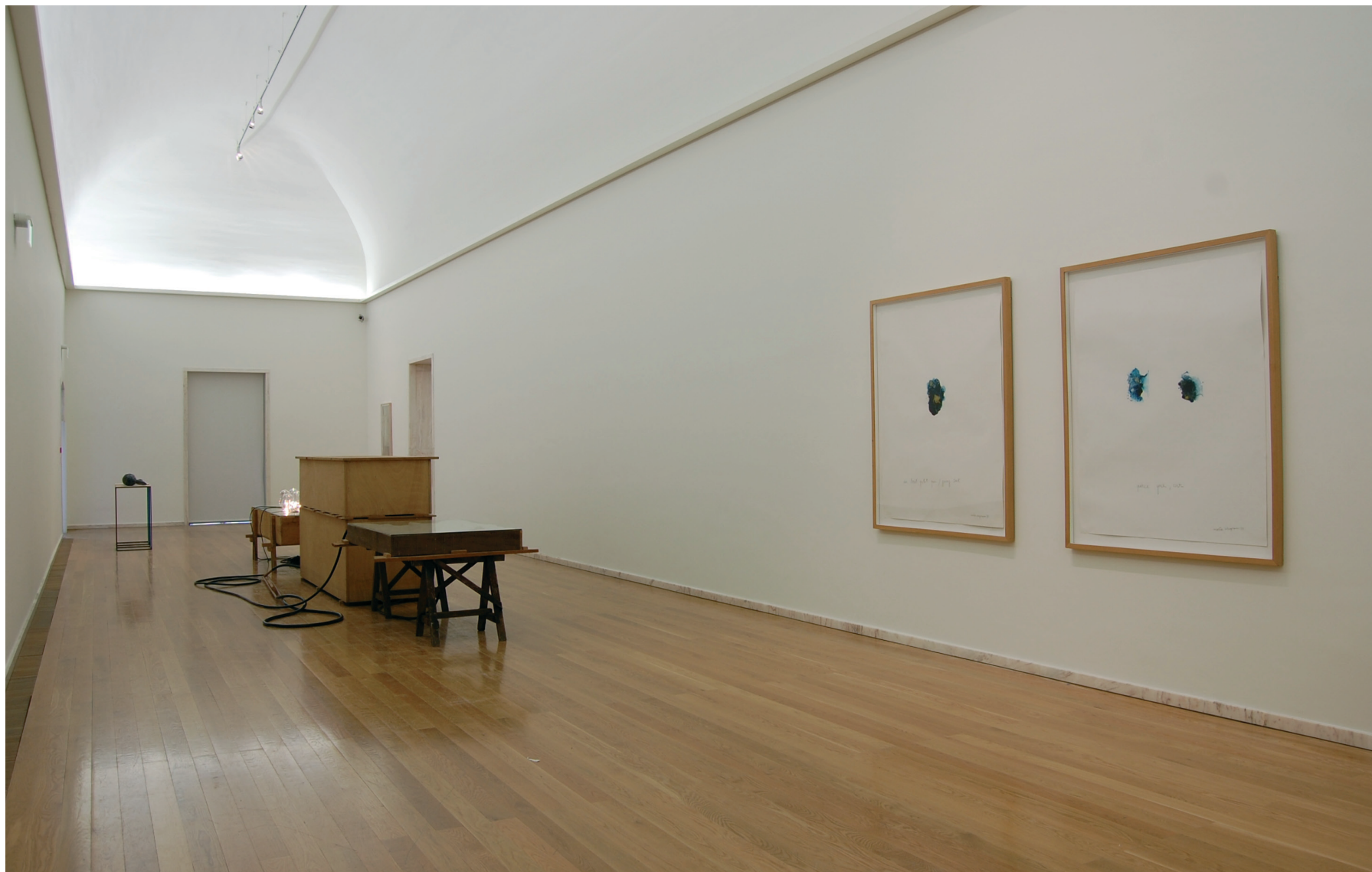
Rui Chafes Respirar-te mais próximo IV , 1989 Ferro pintado Inventário 347257