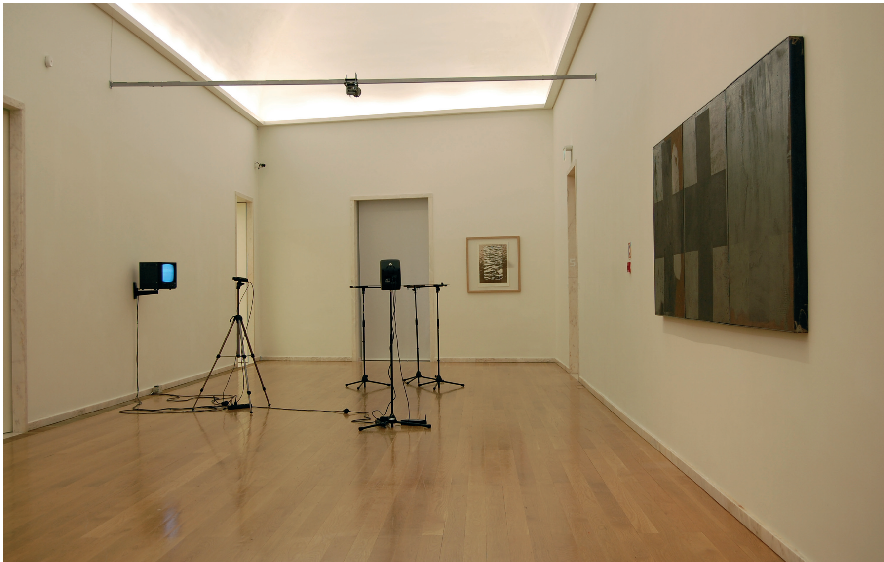
Ricardo Jacinto O (de Eco a Narciso) , 1998 Microfone sem fio, altifalante, espelho, tripés, monitor p/b 11", câmara de vigilância, cabo de aço e motor Inventário 595755