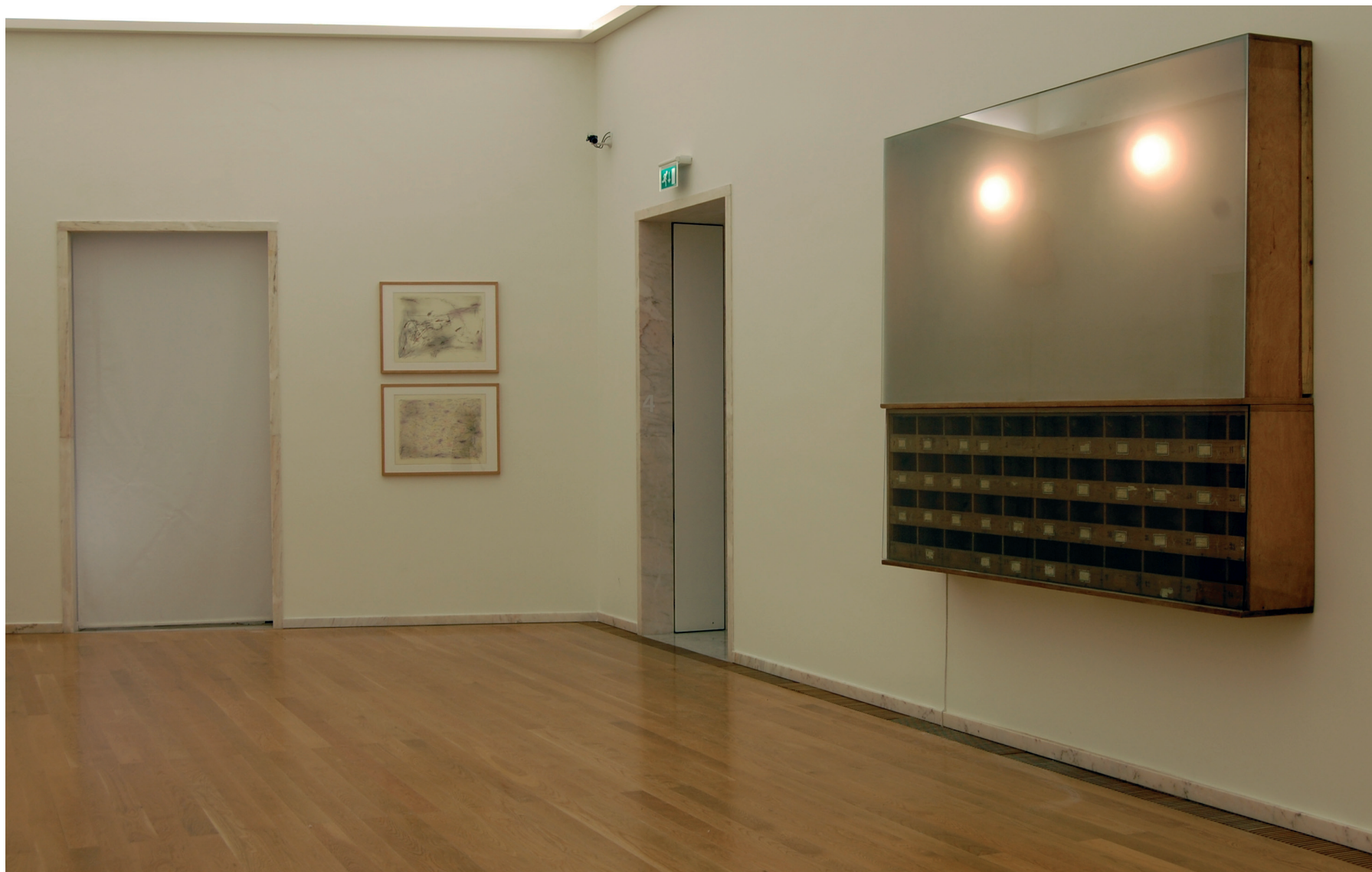
Pedro Cabrita Reis Sem título, 1982 Grafite e lápis de cera sobre papel Inventário 422028