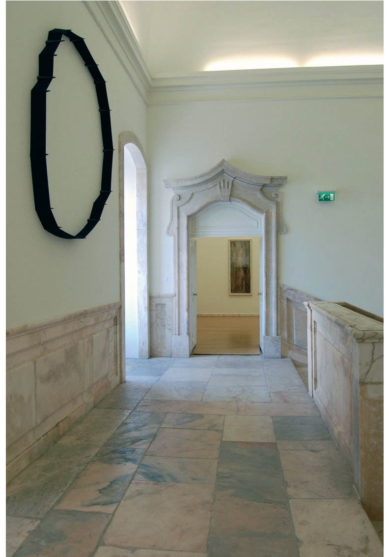
Carmela Gross Ilha I , 1995 Ferro e elástico Inventário 536932