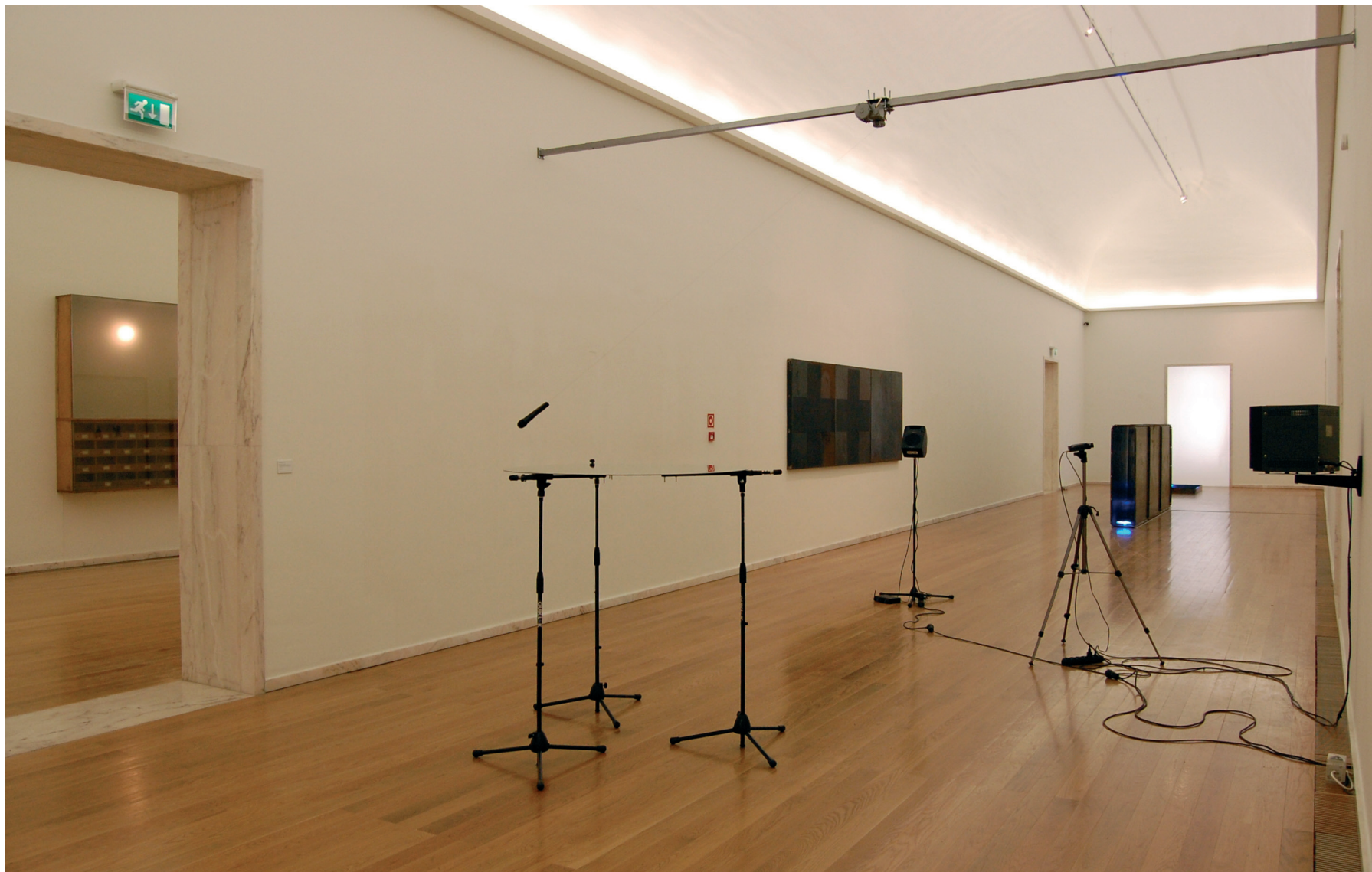
Pedro Cabrita Reis H. suite (XI) , 1993 Madeira, vidro e lâmpadas Inventário 336298