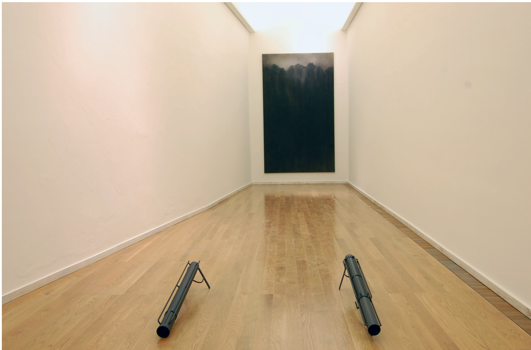
Rui Chafes Debaixo da pele XV , 1992 Ferro pintado Inventário 337192