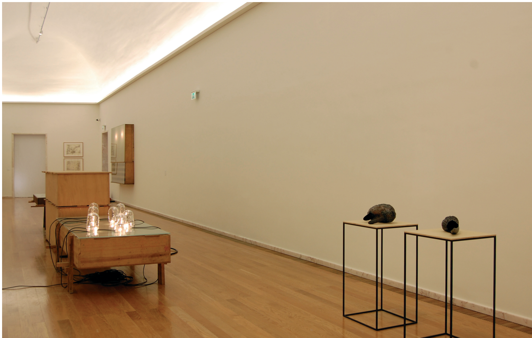
Pedro Cabrita Reis H. suite (XII) , 1993 Madeira, vidro, tubos em cobre, mangueira de borracha, pano cru, campânulas de vidro, lâmpadas, cabos eléctricos e corda Inventário 336299