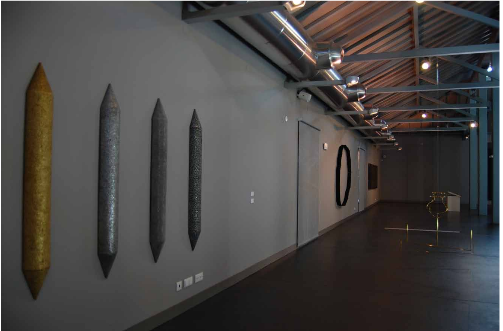
Marcos Coelho Benjamin Sem título, 1999