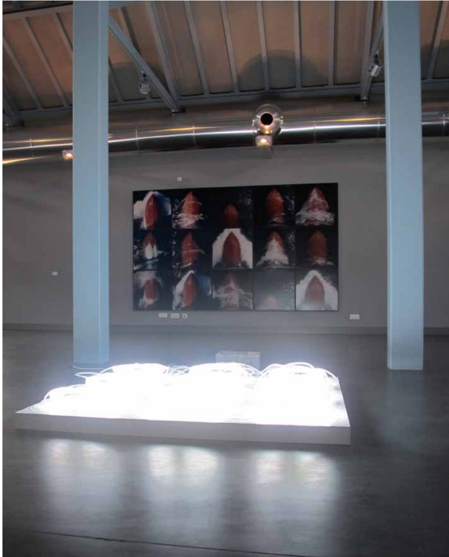
André Cepeda Sequência #9, 2000