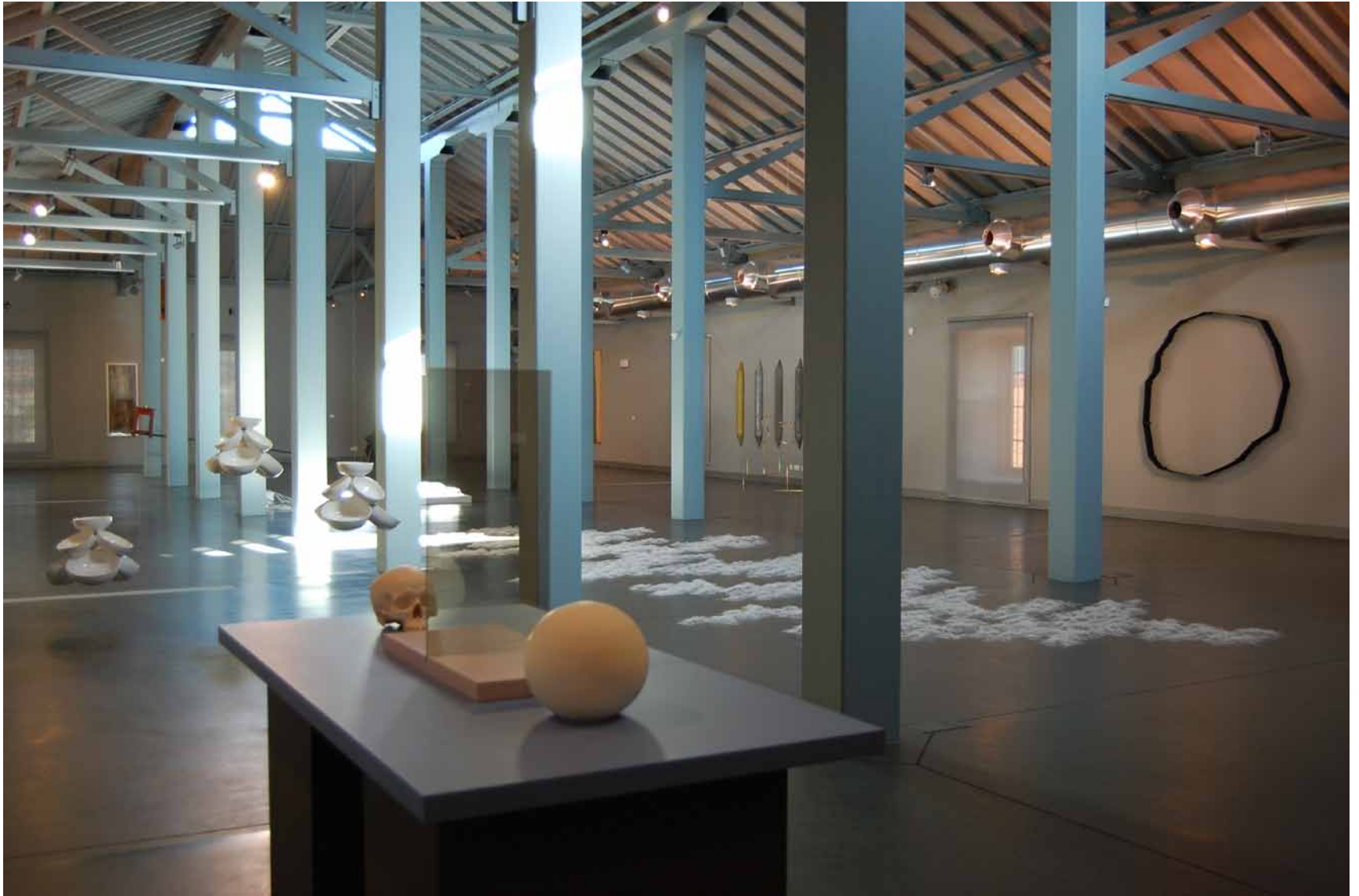
Valeska Soares Les tournants , 2000