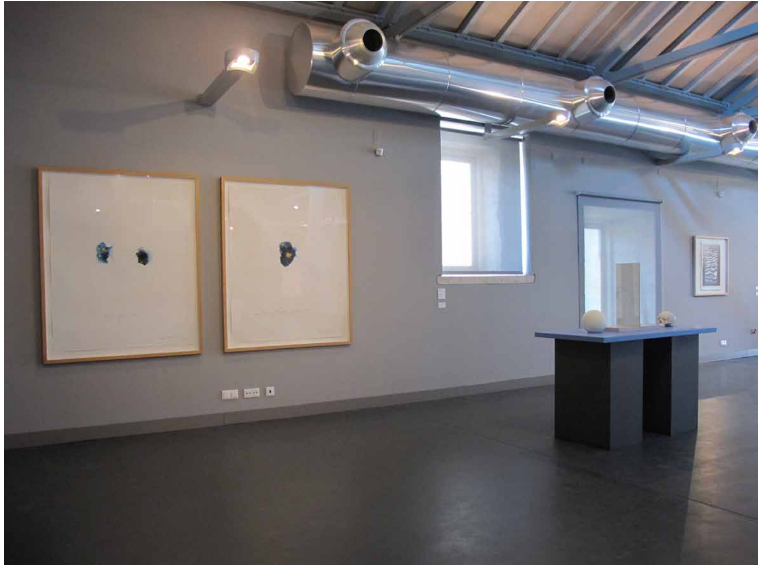
Marta Wengorovius Sem título ( parce que, car ), 1995