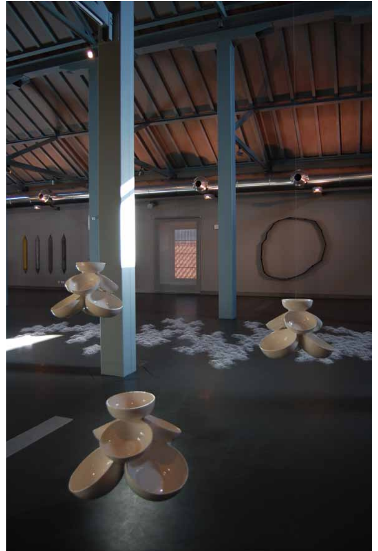
Marcos Coelho Benjamin Sem título, 1999