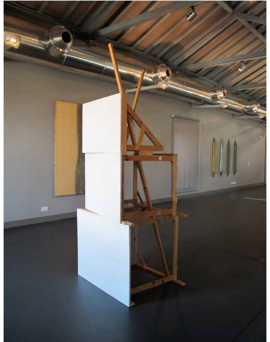
Zulmiro de Carvalho Sem título, 1983