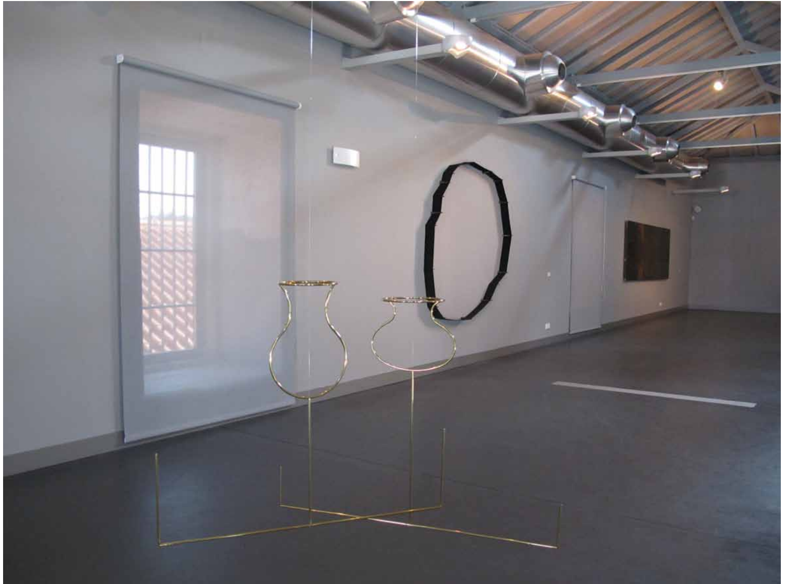
Waltercio Caldas A mesa , 1996