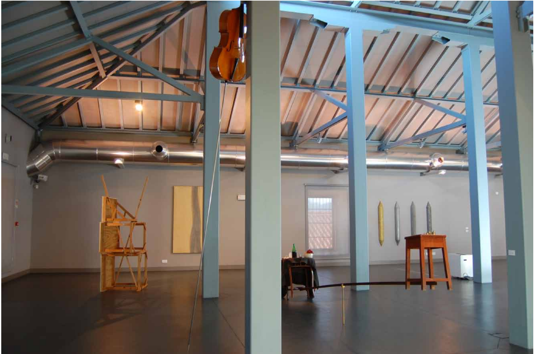
Rui Sanches Retrato de pintor , 1985