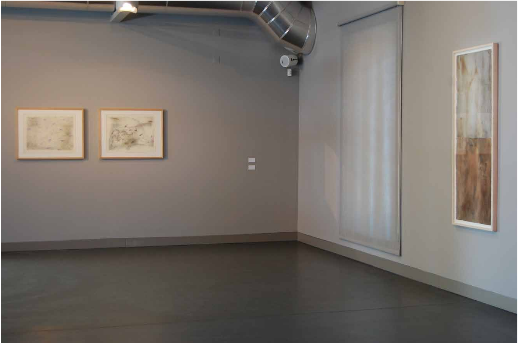
Pedro Cabrita Reis Sem título, 1982