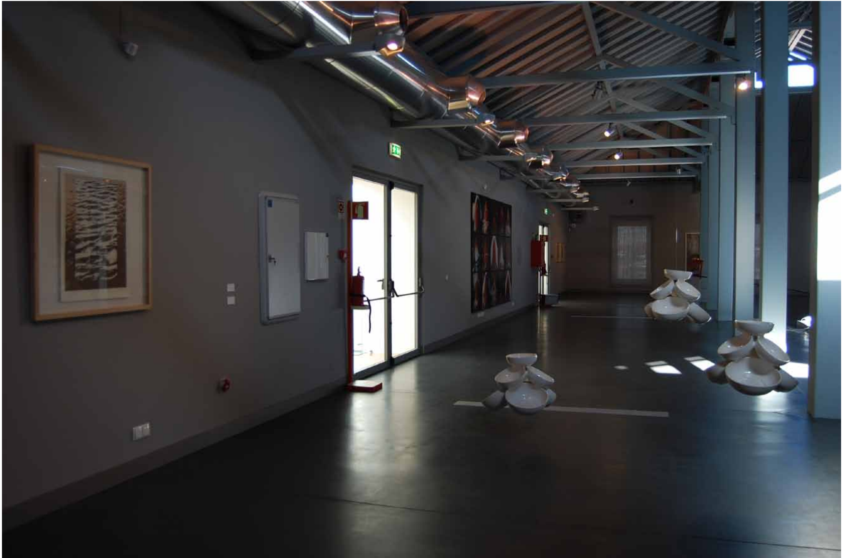
Fernando Calhau Sem título, 1975