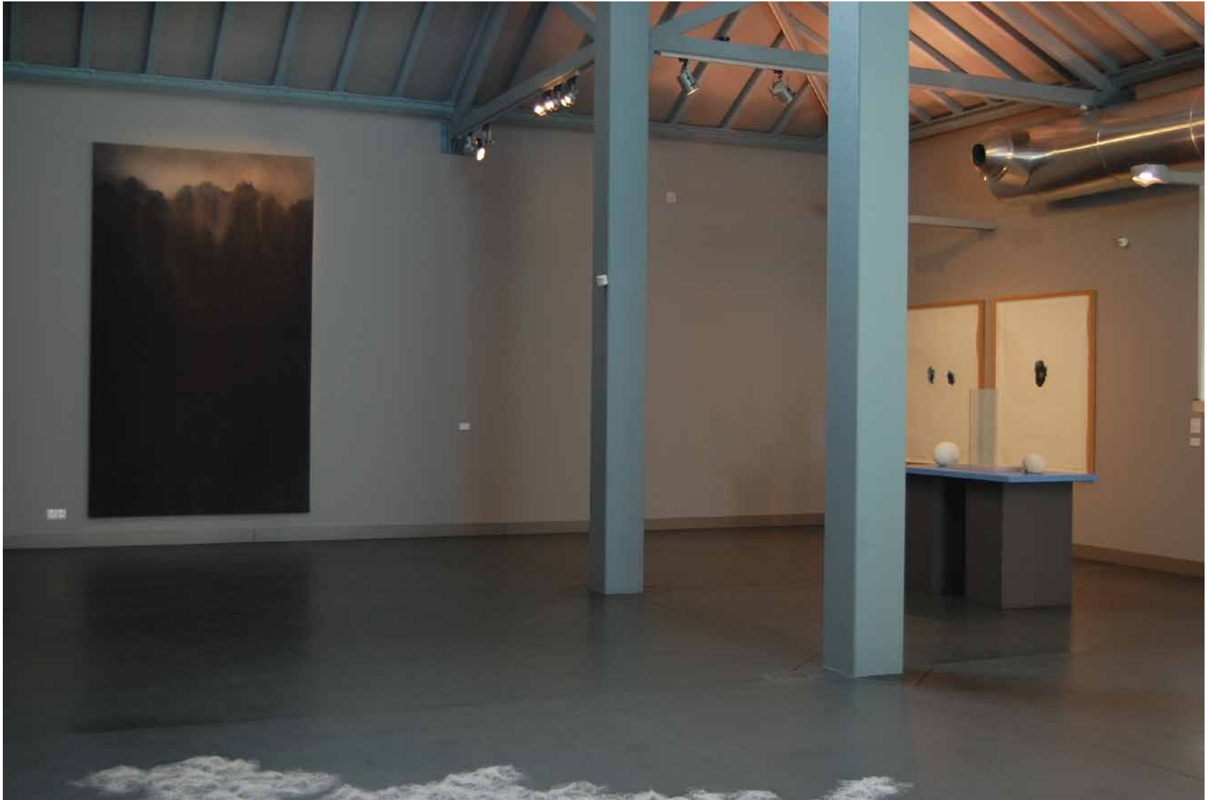
Michael Biberstein Very large attractor , 1991