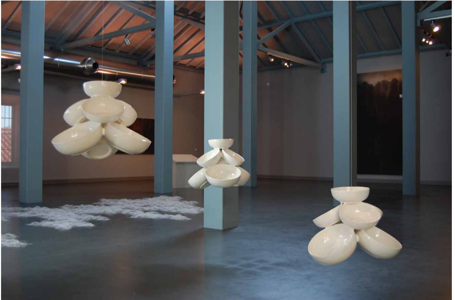
Armanda Duarte Action line , 1999