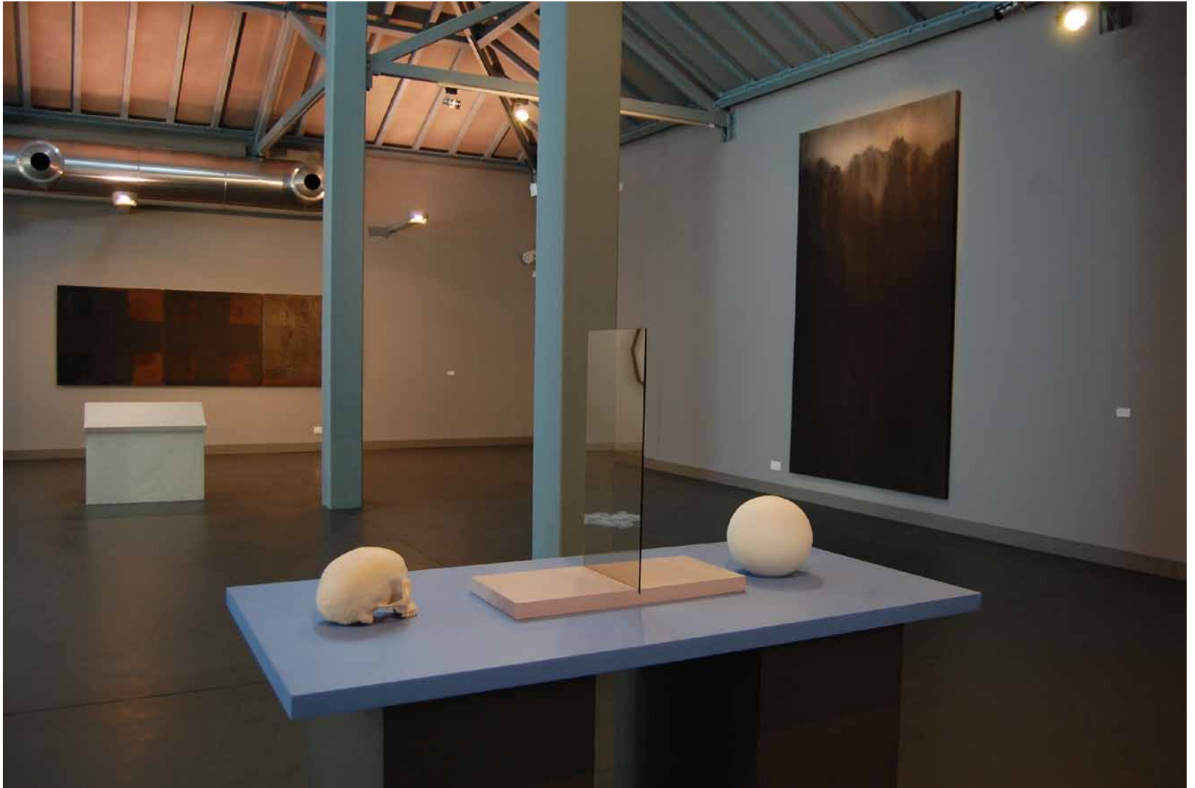
José Pedro Croft Sem título, 1990