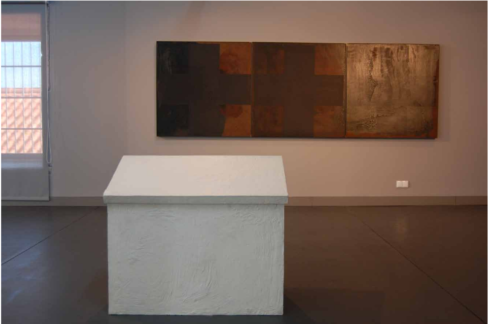
José Pedro Croft Sem título, 1990